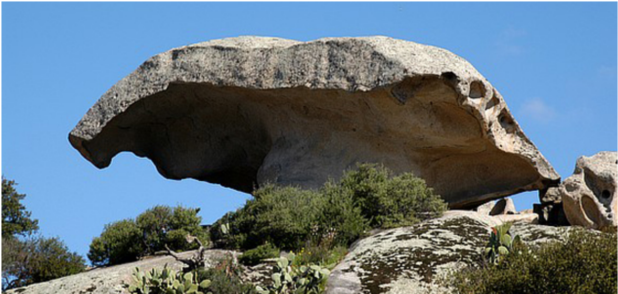
Fig. 2 - Mont'Incappiddhatu, Arzachena.

La población se consolidó en el Neolítico medio y reciente con la presencia de asentamientos estables formados por aldeas de cabañas (Pilastru, Arzachena) o incluso protegidas bajo rocas (Mont'Incappiddhatu, Arzachena) con una economía basada en la agricultura y el pastoreo y, en particular, con el establecimiento de módulos funerarios peculiares antes (necrópolis de círculos megalíticos) y con una difusión territorial más amplia después, cuando el dolmen evolucionó en el fenómeno megalítico (fig. 2).