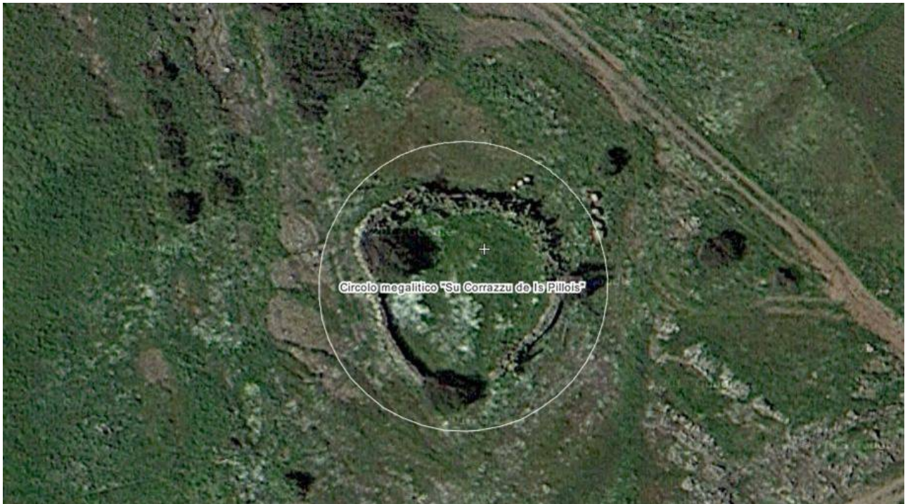
Fig. 3 - Círculo megalítico Su Corrazzu de Is Pillois de Guspini.

Las comparaciones más inmediatas acerca de la arquitectura funeraria de la Gallura se encuentran en los monumentos similares de Córcega (fig. 4), que también pertenecen a la misma época, al igual que en Cataluña, la Linguadoca y la Provenza, que formaron parte de este fenómeno emergente del megalitismo.