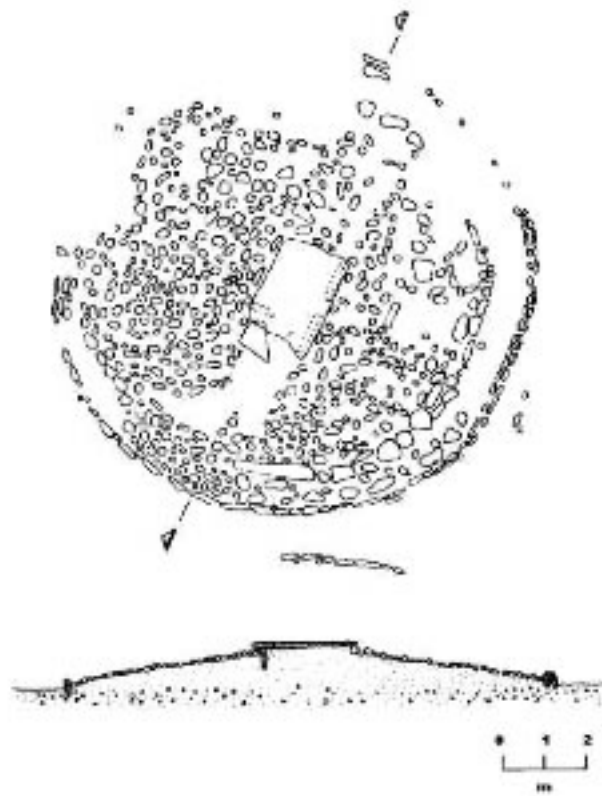
Fig. 2 - La Macciunitta (de Antona, Lo Schiavo, Perra 2011, pág. 243, fig. 2).

En el resto de Cerdeña se conoce el círculo megalítico de Su Corrazzu de Is Pillois en el área de Guspini, que probablemente hace referencia al período entre la segunda mitad del milenio III y principios del milenio II a.C.