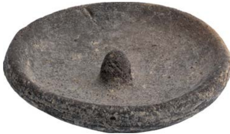
Fig. 5 - Su Nuraxi, cazo en miniatura.

hacia el interior, el labio redondeado y un umbo central con sección circular (fig. 5). Data del siglo IX-VI a.C.