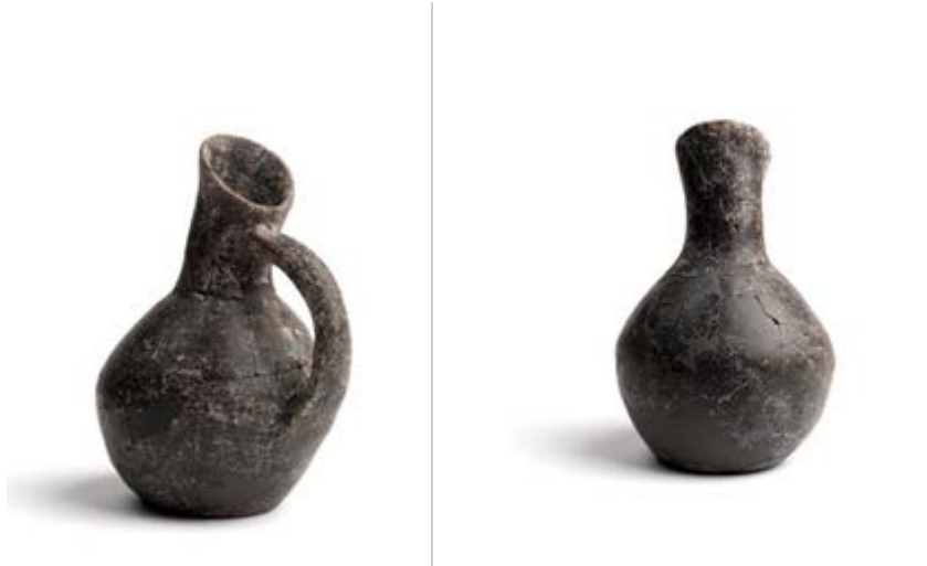
Figs. 3, 4 - Su Nuraxi, jarro askoide hallado en el ambiente beta.

En la cabaña 135 también se ha encontrado otro ejemplar de jarro askoide, con el borde oblicuo y el cuello fuertemente excéntrico, con el cuerpo con tendencia a una forma globular y el fondo plano. La base del cuello presenta una franja decorada, compuesta por líneas horizontales grabadas que enmarcan un motivo con trazados oblicuos grabados (figs. 5 y 6).