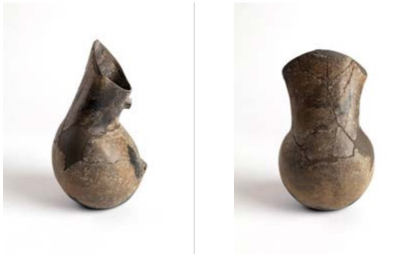
Figs. 5, 6 - Su Nuraxi, jarro askoide hallado en la cabaña 135.

En la cabaña 135 también se ha encontrado otro ejemplar de jarro askoide, con el borde oblicuo y el cuello fuertemente excéntrico, con el cuerpo con tendencia a una forma globular y el fondo plano. La base del cuello presenta una franja decorada, compuesta por líneas horizontales grabadas que enmarcan un motivo con trazados oblicuos grabados (figs. 5 y 6).