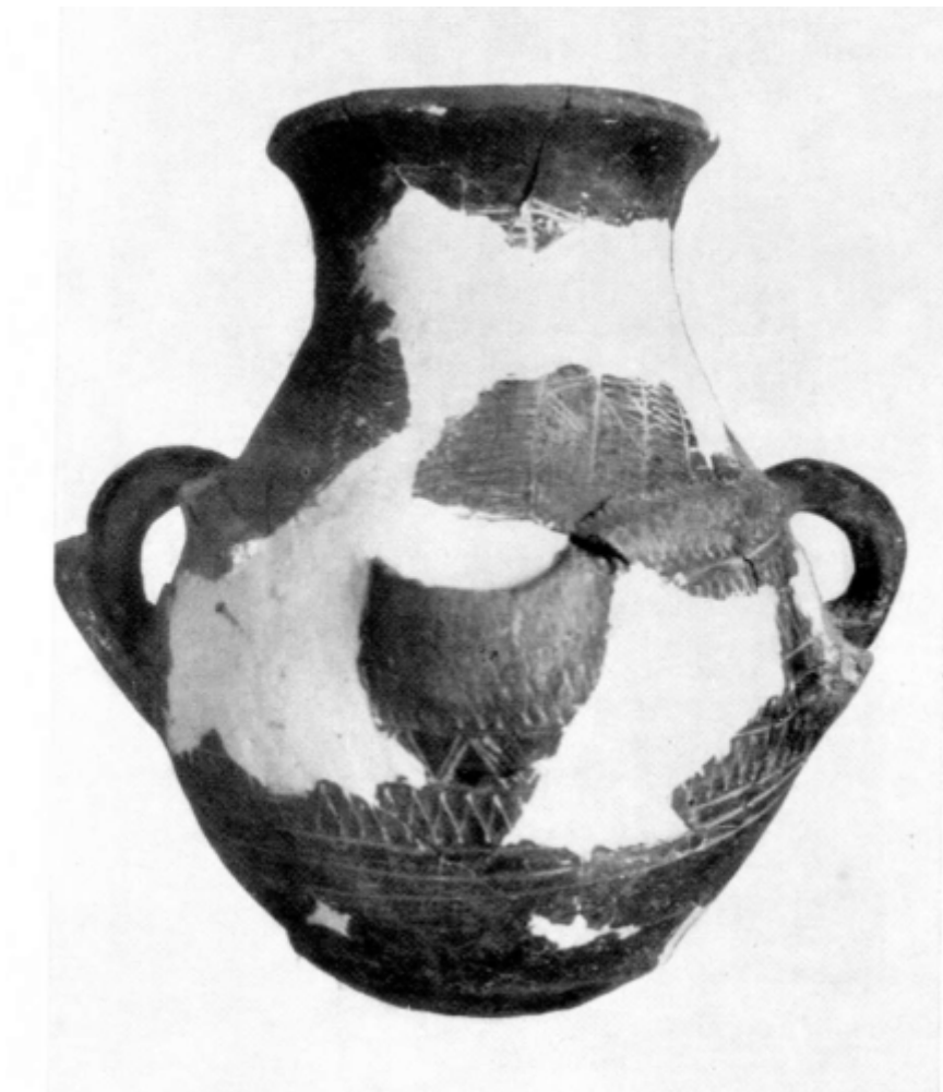
Fig. 1 - Su Nuraxi, jarra piriforme hallada en el ambiente 36 (de Lilliu 1955, lám. XLVIII).

Entre los restos hallados entre las capas de vida y abandono de la cabaña 36 de la aldea nurágica de Barumini, que se exponen en el Museo Casa Zapata de Barumini, hay un ejemplar de vaso piriforme, decorado con asas verticales con puente contrapuestas, y con un pitorro decorativo sobre la panza (figs. 1-4).