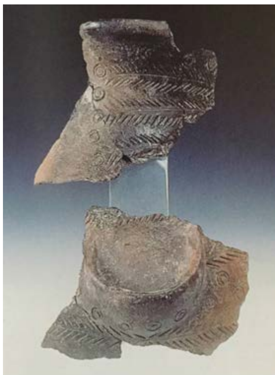
Fig. 5 - Su Nuraxi, fragmentos de la jarra piriforme hallada en la cabaña 135 (de Santoni 2001, fig. 75, pág. 77).