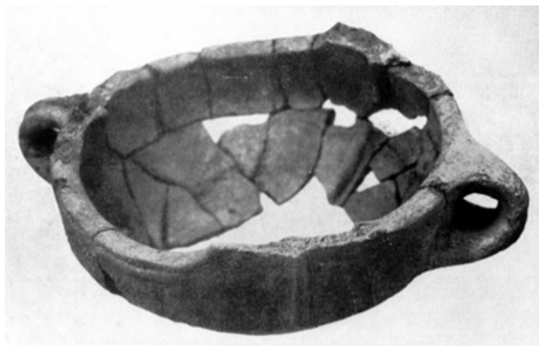
Fig. 1 - Su Nuraxi, recipiente calentador hallado en el ambiente 135 (de Lilliu 1955, lám. LXXII).

El recipiente calentador es un contenedor de forma variada con una función de soporte, en su interior, de otro contenedor de cerámica. Se trata de una forma de vajilla protohistórica que usaron entre la Edad del Bronce reciente y la Edad del Hierro. Está caracterizada por un fondo grueso, realizado por un taco o un pie con forma de anilla, en algunos casos cuenta con un mango, y con los bordes inclinados hacia la pared interna para sujetar mejor el recipiente superior. En las aldeas nurágicas hay evidencia de que lo usaban en ámbito doméstico como base de preparación de alimentos o para calentarlos, cerca de hornillos y planchas de cocción o en contacto directo con las brasas, donde se ha hallado en varias ocasiones junto con capas de ceniza y carbón. En el interior del pozo c de la cabaña 135 de la aldea de Barumini, junto con otros vasos, carbón y cenizas, además de restos de animales, también se ha encontrado un ejemplar de un recipiente calentador (figs. 1-4), de forma baja, un borde inclinado hacia el interior, dos asas con forma de anillo contrapuestas que parten del borde en su máxima expansión. El borde presentaba tres apéndices, que ya están rotos, que estaban decorados por una acanaladura mediana en relieve, que sigue hasta el exterior del asa. En su interior contenía fragmentos de cuernos de ciervo.