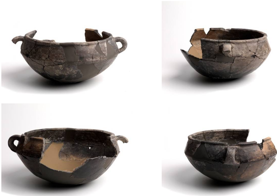
Figs. 2, 3, 4, 5 - Área arqueológica de Su Nuraxi, cazo hallado en el ambiente 135.

Uno de los ejemplares lenticulares de cerámica de pasta (sig. XII-IV a.C.), está discretamente elaborado e impermeabilizado con su acabado brillante, por lo tanto, es adecuado para contener líquidos, ya que reducía al mínimo la porosidad de la arcilla antes de su cocción. Este objeto es de forma alargada, con las paredes hacia el interior, un cuerpo ligeramente profundo, un borde grueso, una carena redondeada, el fondo convexo y dos asas verticales situadas en la máxima expansión del borde (fig. 6). Esta específica categoría de cerámica, que generalmente la usaban en contextos residenciales, está relacionada con la cocción de alimentos, y se tiene evidencia de que se usó desde la Edad del Bronce final hasta la Edad del Hierro I (sig. XII-VIII a.C.).