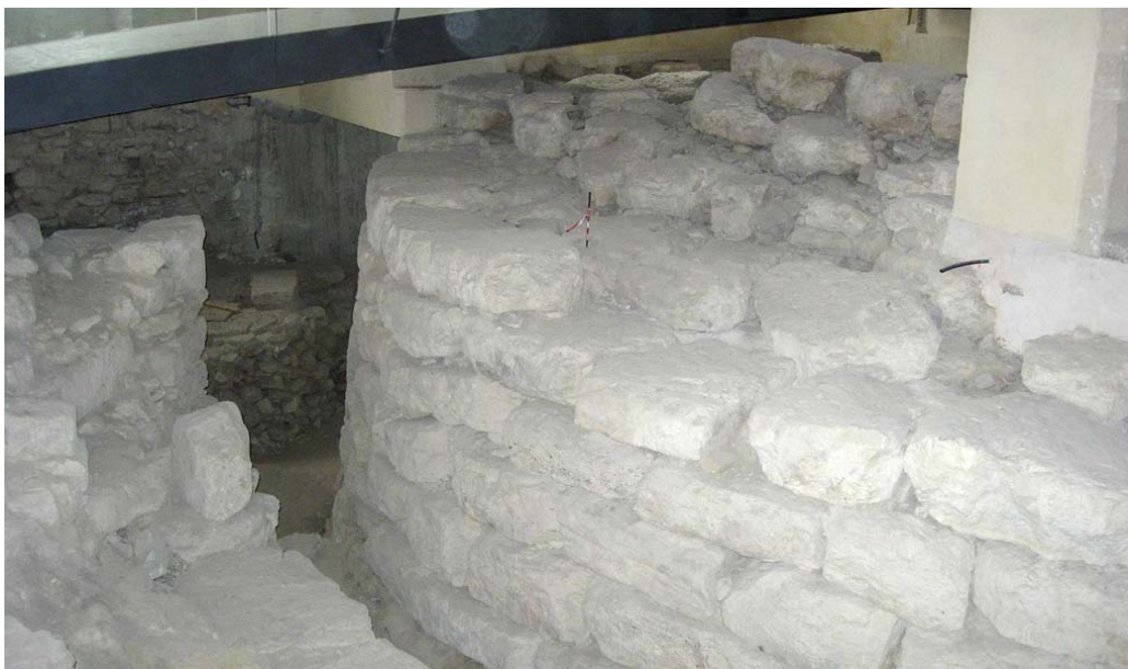
Fig. 3 - Las estructuras nurágicas de Nuraxi 'e Cresia bajo la superficie expositiva de la sección arqueológica.