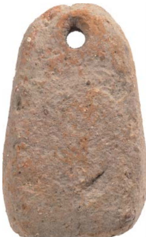
Fig. 1 - Pesa de un telar hallada en el complejo nurágico de Palmavera, Alguer.

Los espacios internos de las cabañas de Su Nuraxi eran sedes de actividades como, por ejemplo, la tejeduría. Gracias a esta actividad que, muy probablemente era un oficio femenino, la fibra hilada (lana y fibras vegetales) la transformaban en tejido a través del cruzado ortogonal de los hilos. Puede ser que con la Era nurágica, la técnica de la tejeduría sufriera algún cambio. Esto lo confirman los escasos hallazgos de pesas de telar de terracota (de forma troncopiramidal y con un solo agujero de suspensión) que usaban para asegurar la tensión de los hilos en los telares. De esta forma, empezaron a usar más el telar vertical con dos rodillos, que no necesitaba la presencia de contrapeso para fijar la urdimbre (figs. 1-3).