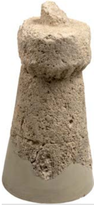
Fig. 5 - Modelo en miniatura de un nuraga del ambiente 80 de la aldea de Su Nuraxi de Barumini.