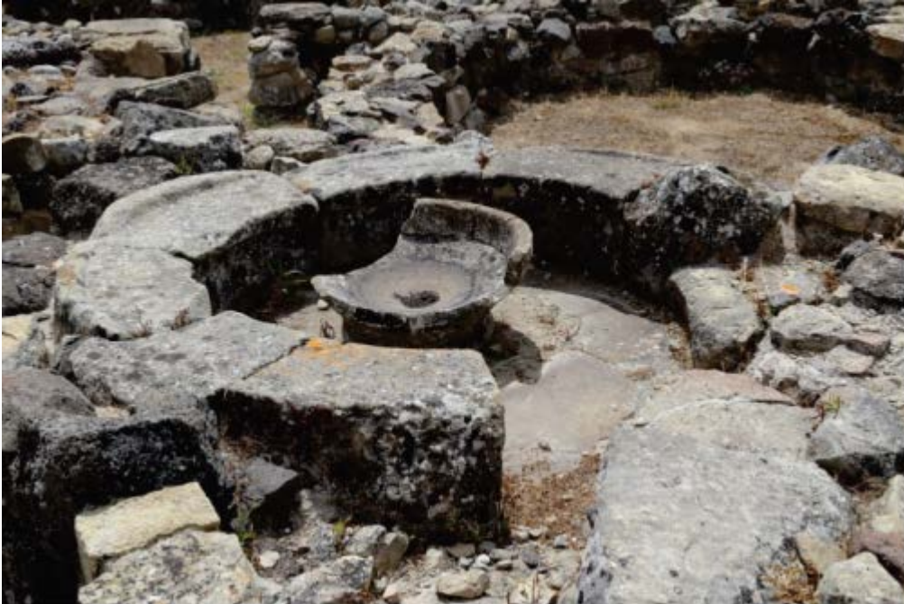
Fig. 1 - Área arqueológica de Su Nuraxi, casa con patio 42, ambiente 90 con asiento y palangana central.

En el interior de un complejo de ambientes colocados tipo insula de la aldea nurágica de Su Nuraxi (cabañas 51, 64, 65, 90, 175, 195, τ, y ππ) se han hallado ocho pequeños espacios circulares denominados «rotondas con palanganas» (figs. 1 y 2).