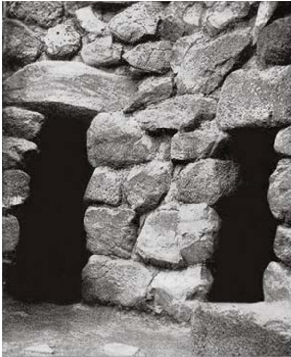
Fig. 2 - Detalle del patio a cuya izquierda se observa la puerta de entrada al ambiente de la torre C (de Lilliu 1962, lámina LXIII.4, pág. 335).

En el interior del ambiente de la torre C, a la izquierda, hay una pequeña celda redonda cubierta por una bóveda (diámetro de 2,60/1,80 m, altura de 3,86 m), precedido por una puerta baja con arquivado con 1,07 m de altura. Se puede deducir que lo usaron como camastro o para depositar las armas.