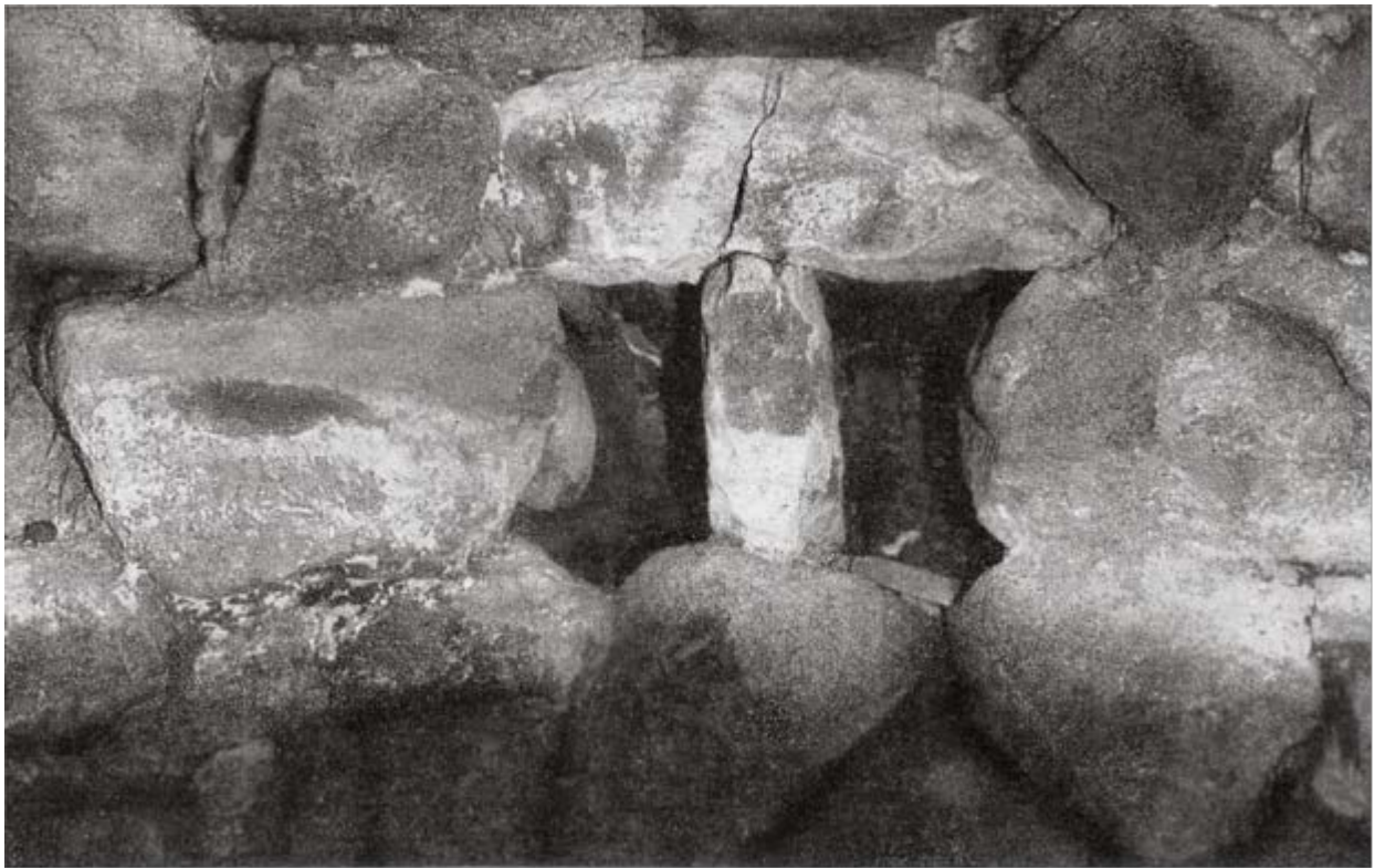
Fig. 3 - Un par de aspilleras en el ambiente de la torre C (de Lilliu 1962, lámina LXIV.3, pág. 336).