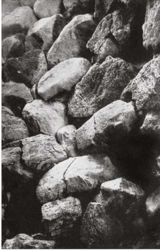
Fig. 3 - Aspilleras de la hilera superior de la pared del ambiente de la torre B (de Lilliu 1962, lámina LXIV.2, pág. 336).