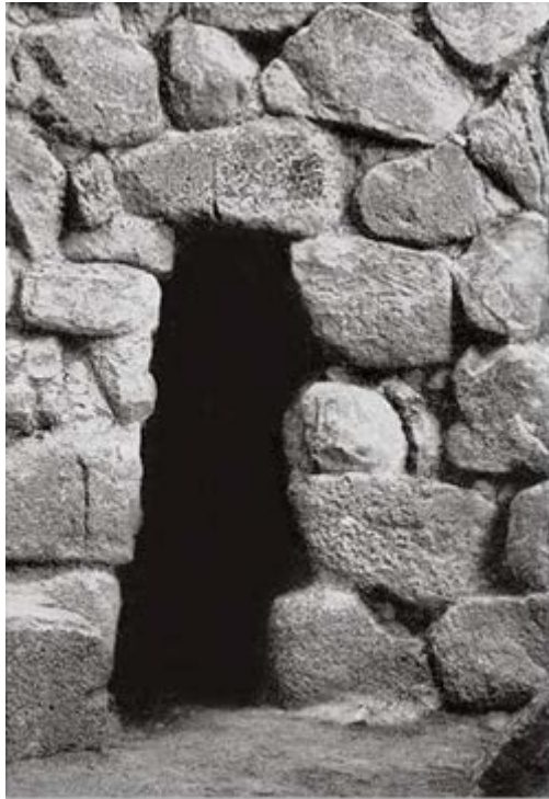
Fig. 2 - Puerta de entrada a la torre B (de Lilliu 1962, lámina LXIII.3, pág. 335).

La pared del ambiente inferior contaba con una hilera doble de aspilleras, que hacían las veces de iluminación y ventilación; el superior, en un origen, tenía una solera de madera y se accedía a él mediante unas escaleras portátiles de madera. Cuando reestructuraron el bastión, entre el siglo XII y X a.C., cerraron las aspilleras (fig. 3).