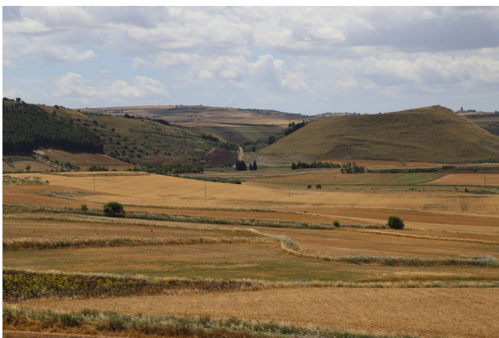
Fig. 1 - Dominio visual del torreó sobre el valle de Pardu'e S'Eda.

El imponente torreón (fase A, 1500-1300 a.C.) es de forma troncocónica (con un diámetro inferior de 10 metros), tiene tres niveles con terraza, y está realizado en opus polygonale encajando aristas de bloques con interbloques y rellenando los espacios con lascas de piedras y tierra. La torre, cuya altura máxima en la actualidad es de 14,10 m, cuando estaba completa llegaba a más de 18 metros, permitiendo una amplia panorámica sobre el valle de Pardu'e S'Eda (fig. 1).