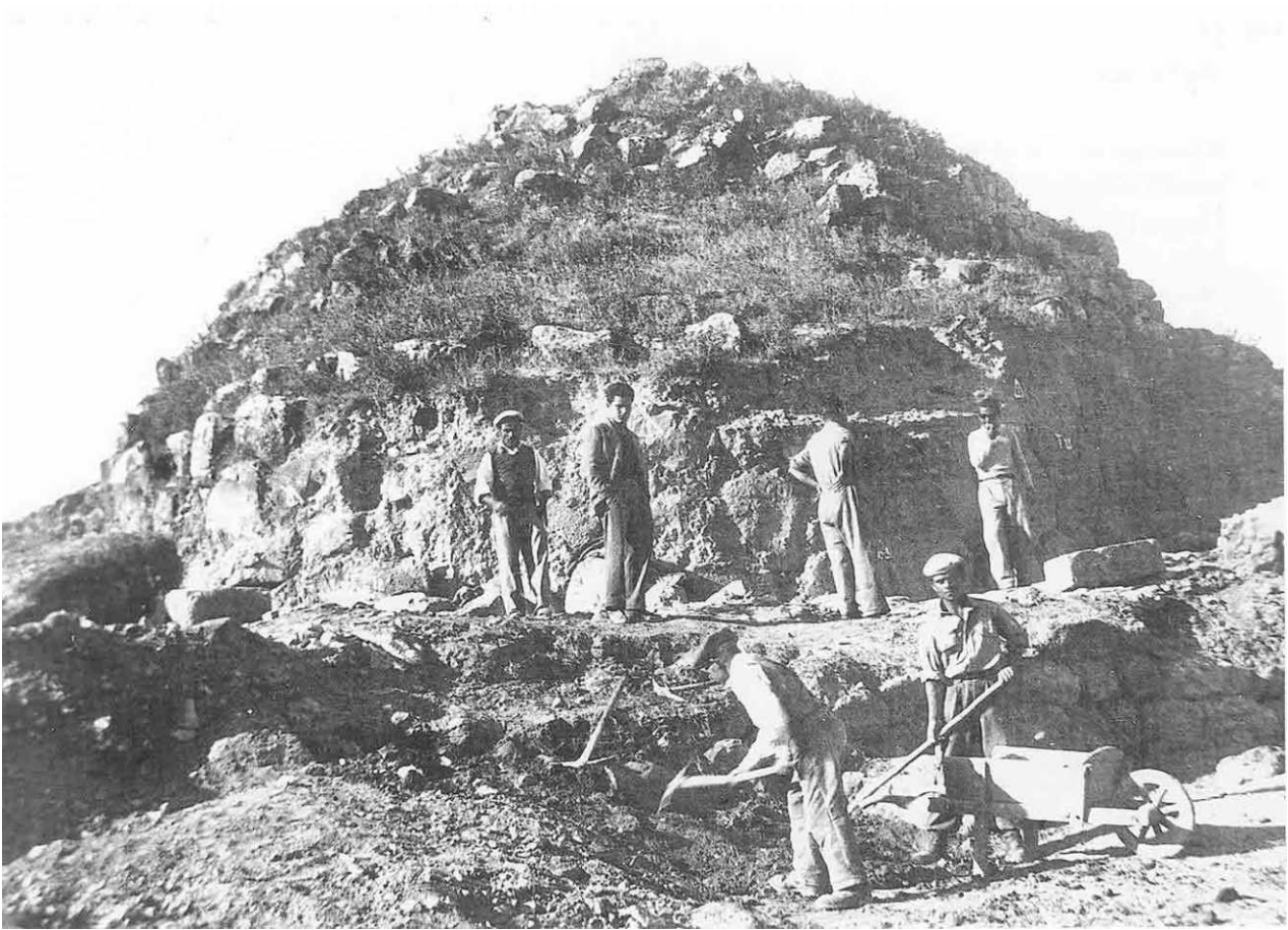
Fig. 1 - Año 1951: la excavación de Su Nuraxi (de Murru 2000, pág. 17).

Los primeros que se dieron cuenta de la presencia en el relieve de «Bruncu Su Nuraxi» de estructuras arqueológicas fueron los empleados agrícolas que trabajaban en este terreno para Oreste Sanna, el propietario de la parcela. La historia de la excavación, en la que participaron alrededor de cien empleados de Barumini, no es muy conocida (fig. 1).