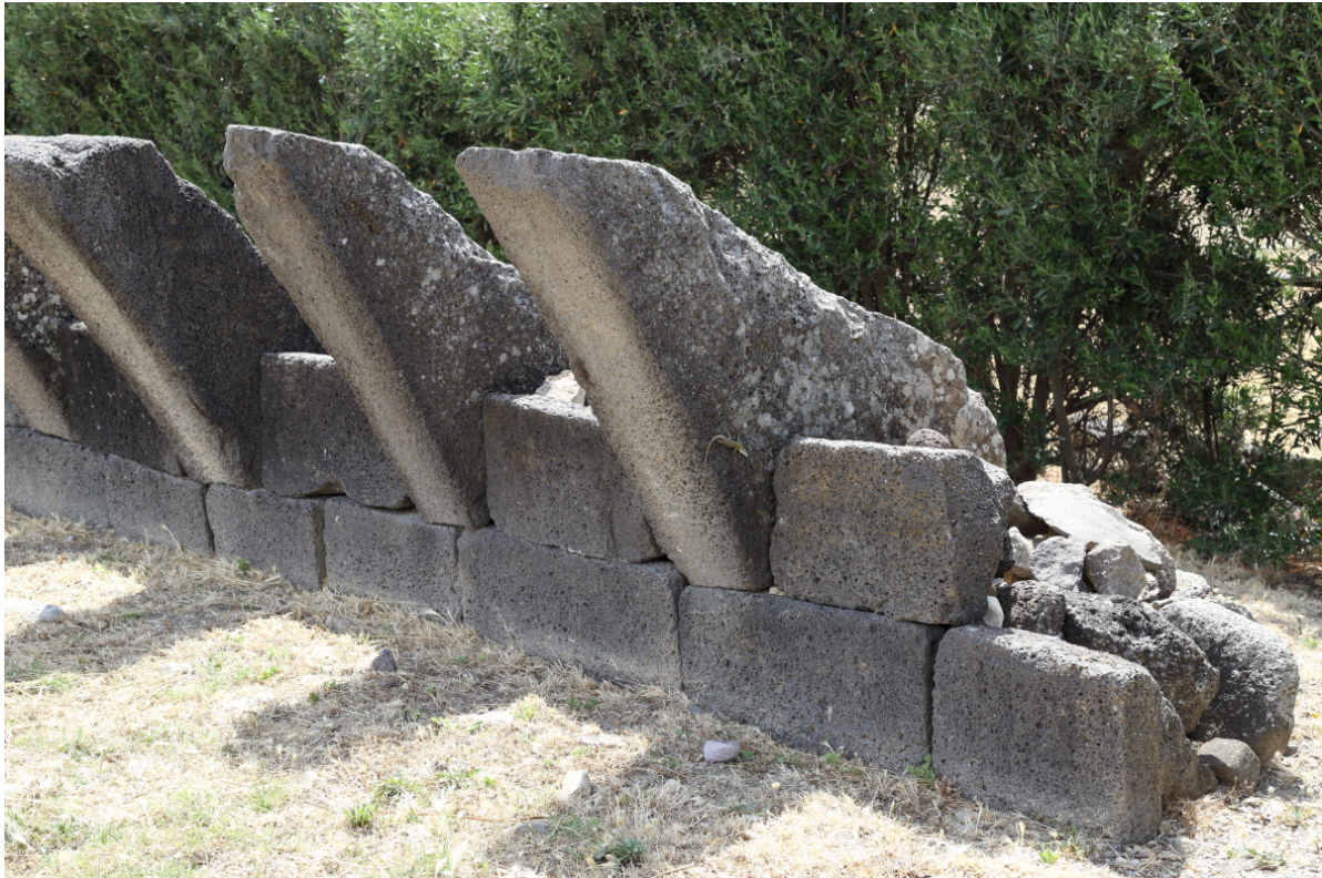
Fig. 8 - Las ménsulas.

El bastión está rodeado por un antemuro, es decir, una muralla torreada, del que en la actualidad se conservan tres torres. Entre el siglo XII y el siglo X a.C., el nuraga fue dañado gravemente, quizás debido a un deslizamiento de la tierra, que provocó lesiones y derrumbes parciales en la estructura. El monumento se reestructuró en todo su perímetro con un gran muro de piedras de basalto grandes. Tras esta intervención, cerraron las aspilleras de las torres y la entrada original. La entrada la desplazaron al muro del noreste y lo elevaron algunos metros respecto a la superficie de la campiña, de la que parten unas escaleras que llevan a la parte superior de las terrazas. En el antemuro, por razones defensivas, añadieron cuatro torres nuevas por un total de siete, que ahora cubren toda la circunferencia del nuraga.