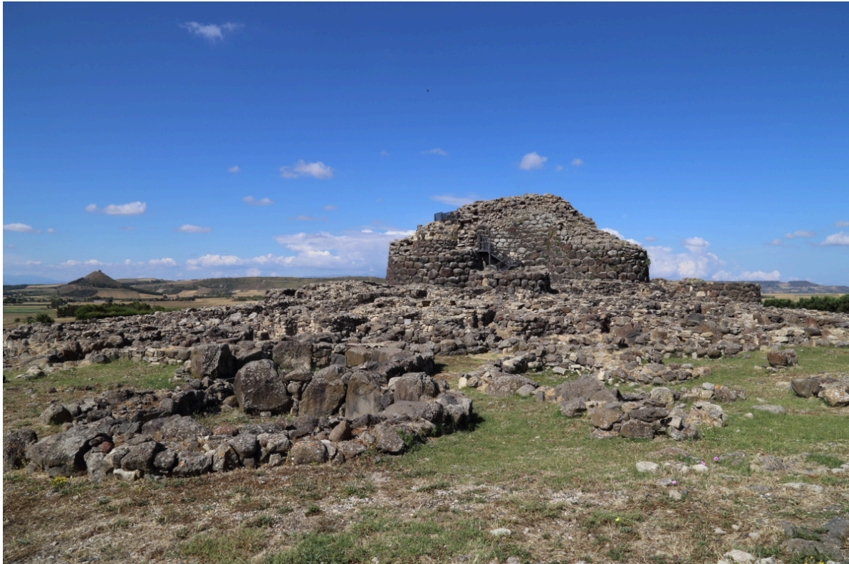
Fig. 5 - El yacimiento de Su Nuraxi.

Los datos relativos a la documentación arqueológica desprenden momentos de vida diferentes a los que corresponden las varias fases de construcción, productos de la cultura material y formas de organización social. La primera fase de vida (sig. XVI - XIV a.C.) se centra en la construcción de la torre central troncocónica, conocida como el torreón, creada mediante grandes bloques poliédricos de basalto «en seco» y con una altura original de más de 18 metros. Estaba compuesta por tres ambientes uno encima del otro. El ambiente inferior estaba separado del eje vertical de la torre porque estaba precedido por un nicho profundo. Había unas escaleras que comunicaba los diferentes niveles. El torreón todavía conserva los dos ambientes superiores, con una altura de 14,10 metros y un diámetro inferior aproximado de 11 metros. Entre finales del siglo XV y el siglo XIII a.C., sobre la estructura más antigua del nuraga colocaron el bastión cuadrilobulado: cuatro torres unidas mediante un muro recto en los extremos de una figura cuadrangular. La parte terminal externa de la torre estaba formada por una terraza sujeta por grandes ménsulas, también de piedra. La entrada se abría en el muro sureste: a través de un pasadizo con dos nichos contrapuestos se accedía al interior del espacio a cielo abierto del