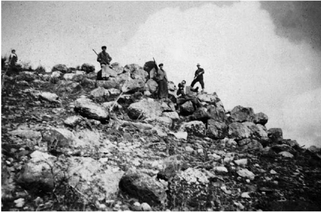
Fig. 2 - El nuraga antes de las excavaciones (de Lilliu, Zucca 1988, fig. 8, pág. 28).

El área arqueológica incluye un gran nuraga, con torre y reparos, murallas con torres, que se erige majestuoso respecto a la aldea de cabañas de alrededor (fig. 3).