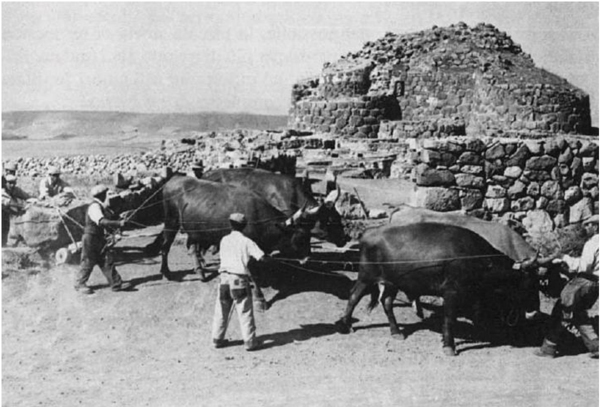
Fig. 4 - Área arqueológica de Su Nuraxi, excavaciones 1951-56 (de Lilliu, Zucca 1988, fig. 10, pág. 29).

La excavación sistemática del complejo del asentamiento (fig. 4), llevada a cabo bajo la dirección del mismo Lilliu desde 1951 hasta 1956, con la ayuda de empleados contratados entre los jornaleros del pueblo y con medios muy rudimentarios de aquella época, permitió identificar las varias fases de vida que demuestran la ocupación del lugar desde mediados del milenio II a.C. (aprox. 1600 a.C.) hasta los tiempos de la frecuentación púnica y romana (siglo III d.C.)