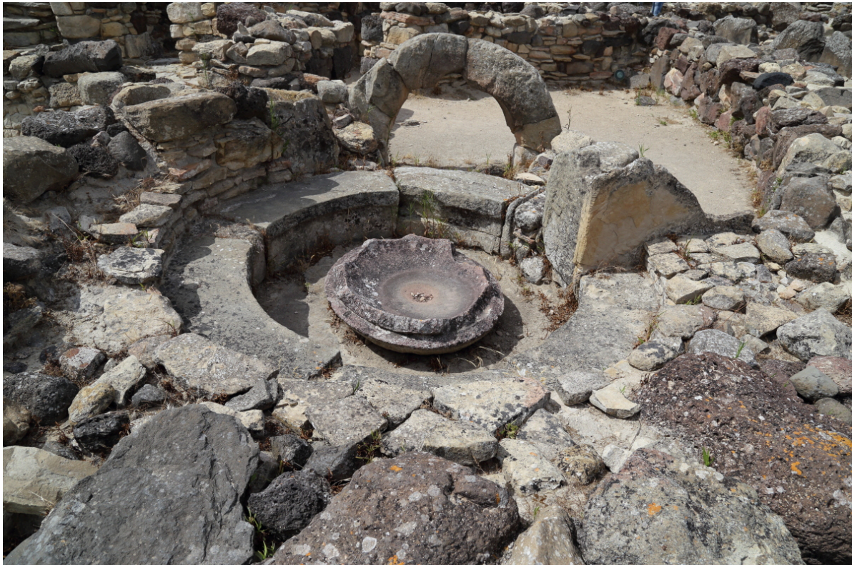
Fig. 10 - La rotonda con la palangana (foto de Unicity S.p.A.).

cuadrangulares, que, probablemente, tenían un techo de madera, convergentes con elementos radiales, y de forma centrípeta alrededor del patio redondo empedrado, una especie de patio interno. El ambiente más significativo es la «rotonda», un pequeño cuarto que, muy probablemente, en un origen tenían un techo con una cúpula decorativa, dotada de un asiento bajo y una palangana central que servía para contener el agua, que probablemente usaban para los rituales (fig. 10).