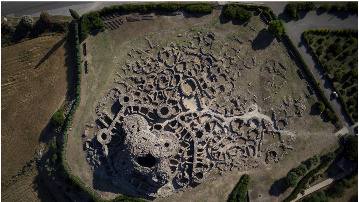
Fig. 3 - Fotografía aérea del área arqueológica.

El área arqueológica incluye un gran nuraga, con torre y reparos, murallas con torres, que se erige majestuoso respecto a la aldea de cabañas de alrededor (fig. 3).