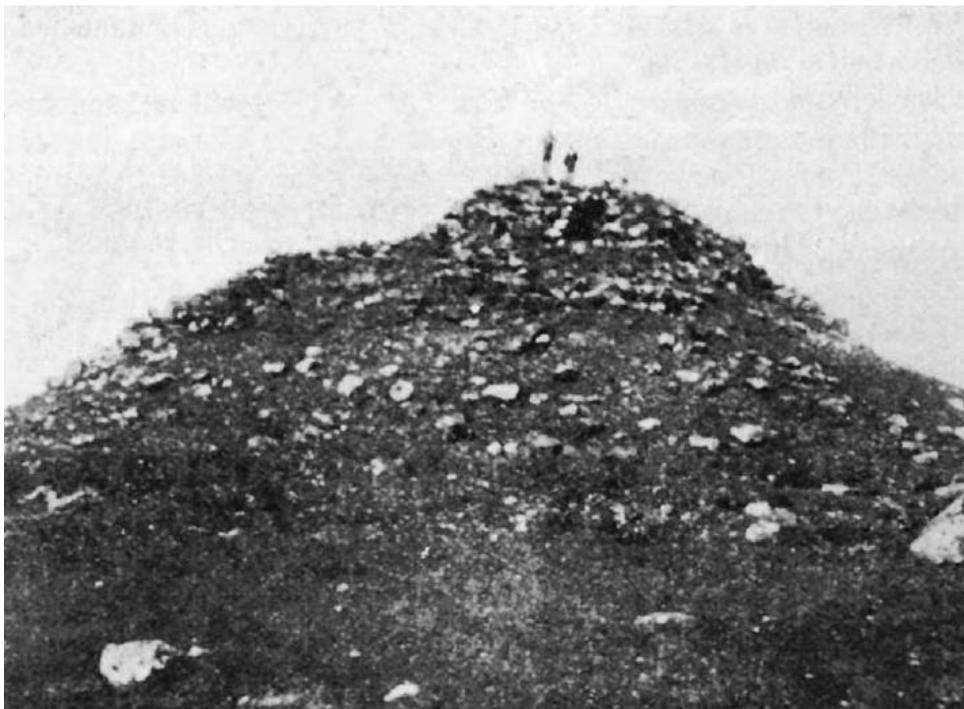
Fig. 1 - Área arqueológica de Su Nuraxi, el nuraga antes de las excavaciones, en 1937 (de Lilliu, Zucca 1988, fig. 6, pág. 24).

El yacimiento de Su Nuraxi di Barumini surge en la fértil región de Marmilla, sobre una terraza margosa que domina la fértil cuenca de Pardu'e S'Eda, donde en una época se cultivaba el trigo. «Hay pocos restos de otros edificios nurágicos, o solamente se conserva el nombre al pie de la costa (de la Giara), como Bruncu su Nuraxi, en el camino de Tuili a Barumini», escribió el arqueólogo Antonio Taramelli en 1907. Las fotografías más antiguas de Su Nuraxi, el nuraga por excelencia, datan de 1937 (fig. 1), en estado de derrumbamiento y con el aspecto de una pequeña colina.