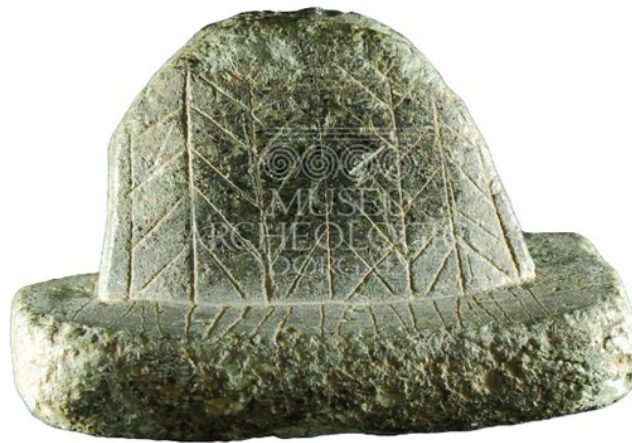
Fig. 1 - Alisador (de http://www.museoarcheologicodorgali.it/wp/museo_archeologia_in_sardegna/la-storia-di-dorgali-in-20-reperti/ )

En la década de 1930, Antonio Taramelli halló un alisador de esteatita en la pequeña aldea nurágica de Isportana, cuyas ruinas se encuentran en la periferia sureste de la localidad de Dorgali, junto con fragmentos de cerámica, pesas de telar y cuentas de collaras en pasta vitrea.