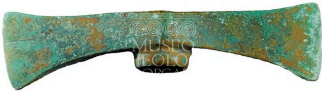
Fig. 3 - Hacha doble de bronce de Serra Orrios-Dorgali