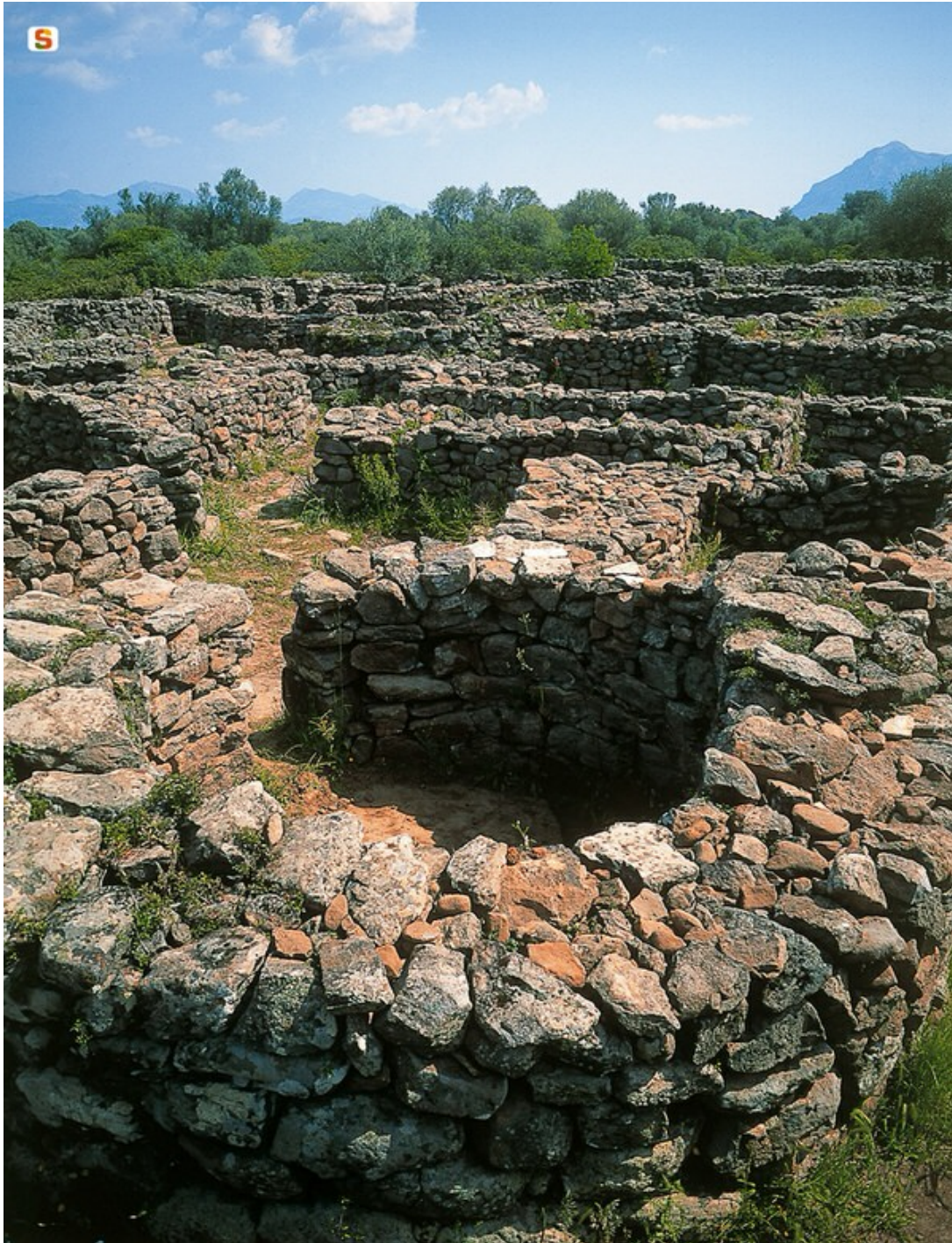
Fig. 2 - Detalle de las cabañas de la aldea de Serra Orrios-Dorgali (de http://www.sardegnaigitallibrary.it/index.php?xsl=615&s=17&v=9&c=4461&id=63111 ).