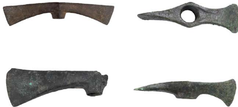
Fig. 5 - Hachas dobles halladas en los contextos nurágicos sardos (de DEIANA 2014 pág. 293).

El hacha doble de Serra Orrios, de tipo con cortes paralelos y con cuello, tiene la cara superior plana, el lado inferior semicircular, dos cortes salientes paralelos en los lados del