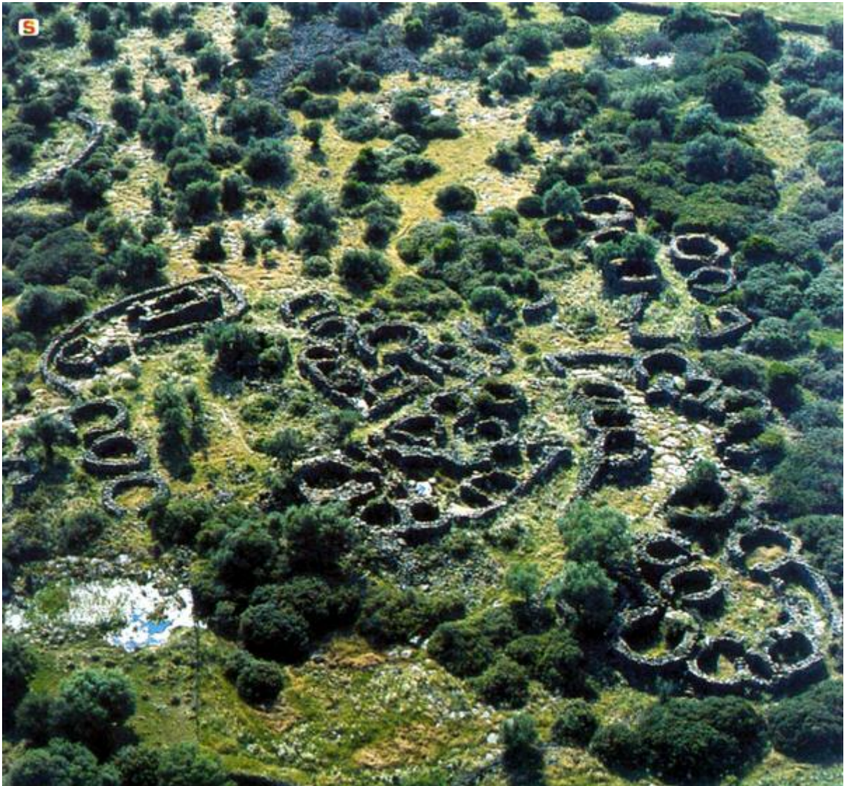
Fig. 1 - Vista aérea de la aldea nurágica de Serra Orrios-Dorgali (de http://www.sardegnaigitallibrary.it/index.php?xsl=615&s=17&v=9&c=4461&id=102911 ).

De la aldea nurágica de Serra Orrios, en el territorio de Dorgali (figs. 1 y 2), proviene un hacha doble (fig. 3), una herramienta de aleación de bronce que usaban para trabajar la madera.