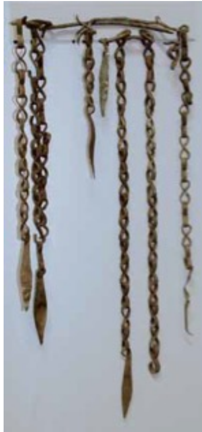
Fig. 5 - Collar de bronce con cadenas con elementos con forma de hoja, hallado en el nuraga Sanu-Taccu de Osini, expuesto en el Museo espeleo-arqueológico de Nuoro (de FADDA 2006, fig. 65, pág.62).

Incluso a nivel interpretativo, la función de estos objetos es controvertida: la mayoría de los expertos 5 concuerda en considerarlos objetos decorativos.