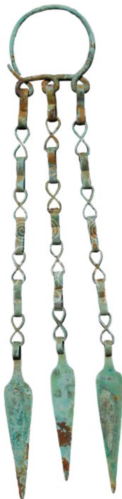
Fig. 1 - Colgante de Tillai-Dorgali.

En Tillai 1 , en el territorio de Dorgali, se ha hallado un colgante 2 de bronce formado por cadenas (fig. 1) de bronce de las que cuelgan láminas y dijes con formas de lanzas, que en la actualidad está expuesto en el Museo arqueológico de Dorgali junto con otros objetos similares procedentes de la misma localidad.