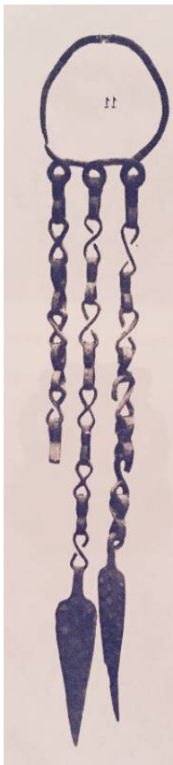
Fig. 3 - Colgante con cadenas hallado en un nuraga de Tiana (de PINZA 1901, lám. XVII, pág. 171)

Además, este tipo de objeto se puede comparar con ejemplares de colgantes de cadenas muy parecidos, formados por anillas de lámina con forma de 8 y colgantes lanceolados, hallados en varias localidades de Cerdeña (muchos de ellos desconocidos), en nuragas, tumbas y ambientes cerrados (Lanusei, Tiana, Gadoni, Serri, Ballao, etc.) y de los cuales se tiene noticia a partir de la segunda mitad del siglo XIX tras las excavaciones llevadas a cabo en aquella época, o gracias a descubrimientos fortuitos o abusivos, generalmente asociados a contextos estratigráficos mezclados (figs. 3-5). Por lo tanto, según los datos publicados hasta el momento, es difícil atribuirlos a una cronología y a una cultura específicas. Hasta hace poco tiempo se dataron en la era nurágica 3 (siglo VIII-VII a.C.), sin embargo, hoy en día se prefiere enmarcarlo en la Edad Media Alta 4 .