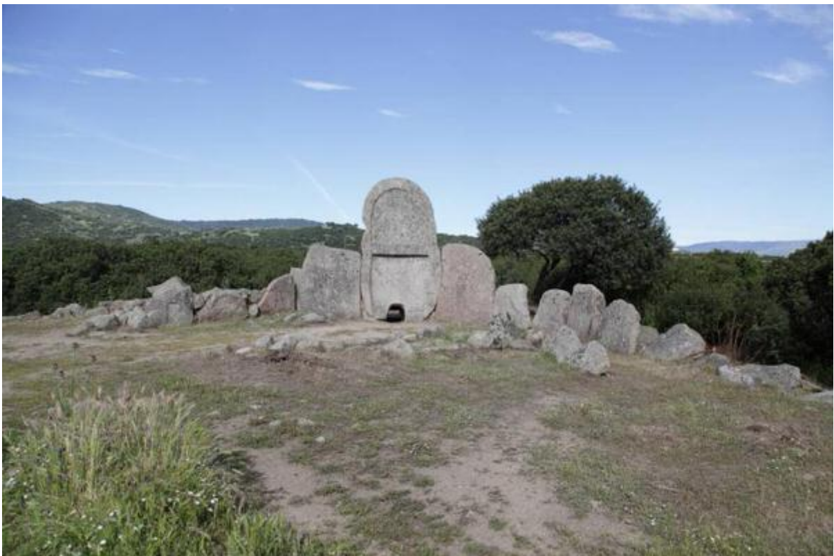
Fig. 1 - Tumba de los gigantes de Thomes, Dorgali.

Hay una botella de cerámica vidriada, recipiente que usaban para contener líquidos, caracterizada por un revestimiento de plomo de color verde, que proviene de la excavación de la exedra de la tumba de los gigantes de Thomes (figs. 1 y 2), de un contexto estratigráfico revuelto. El objeto, que se dañó en la fase de recuperación, se pudo arreglar inmediatamente in situ .