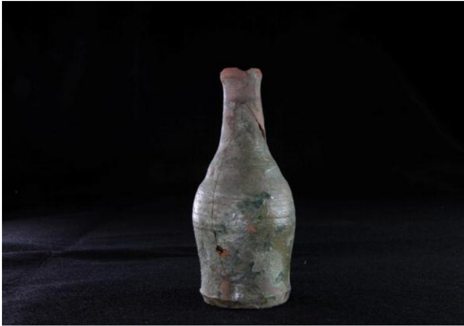
Fig. 3 - Botella medieval de la tumba de los gigantes de Thomes-Dorgali (foto de Unicity S.p.A.).