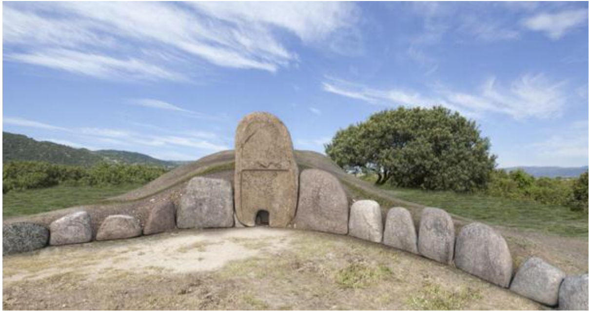
Fig. 2 - Render del área de la exedra de la tumba de los gigantes de Thomes, Dorgali.

Con una altura aprox. de 14 cm, pertenece a la clase de cerámica revestida de tipo "vitrina esparcida", que llamaron de esta forma porque la vitrina, distribuida en partes, cubre sólo algunas partes de la superficie del objeto 1 . Se usó en Italia durante la Antigüedad tardía y la Edad Media Alta. En el contexto arqueológico peninsular, este tipo de cerámica se ha encontrado, por ejemplo, en los asentamientos toscanos de Scarlino-Grossetto y de Rocca San Silvestro-Livorno, y en las localidades de Arezzo, Lucca y Chiusi, y más generalmente en las regiones del centro de Italia. La botella hallada en Thomes tiene una base plana, sin soporte, con un cuerpo con un perfil subcilíndrico que se une a la parte trasera troncocónica, un cuello cilíndrico y el borde ligeramente estroflexo. La pasta dura ha sido depurada y es de color rojo-marrón (figs. 3 y 4). En las áreas con un revestimiento con un grosor mayor hay una vitrina más brillante, de color verde, con una superficie irregular y con burbujas. El resto de áreas, que han sido absorbidas por la pasta, son opacas, con algunas partes con trazados de color amarillo-naranja.