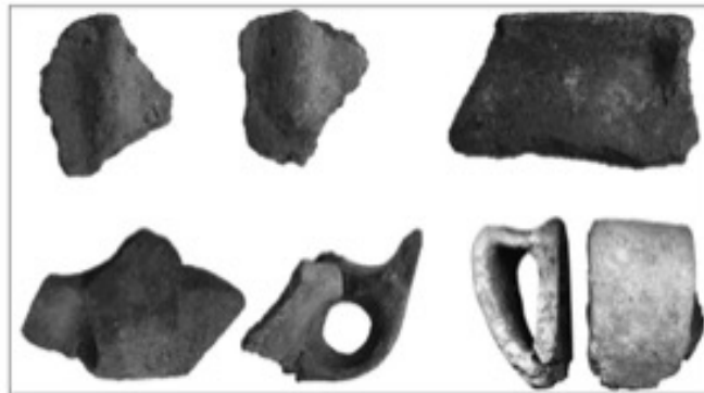
Fig. 5 - Tumba II Sa Figu-Ittiri, asas angulares con o sin elevación con forma de hacha de Sa Turracula-Bronzo Medio (de MELIS 2011, FIG. 7, PÁG. 113).

de la facies de Sa Turracula (1600-1500 a.C.), típica de las fases iniciales de la Edad del Bronce Media (como ejemplo se citan los contextos de las tumbas de los gigantes de Li Lolghi y Coddu Vecchiu en el territorio de Arzachena, de Su Picante en el territorio de Siniscola, y del dolmen de Mariughia en el territorio de Dorgali), relacionado con formas de cerámica como tazas, vasos carenados y ollas con un borde distintivo y un cuerpo globular (figs. 5 y 6).