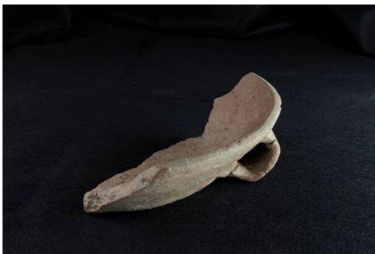
Figs. 1, 2 - Fragmento de la cazuela de la tumba de los gigantes de Thomes-Dorgali (foto de Unicity S.p.A.).