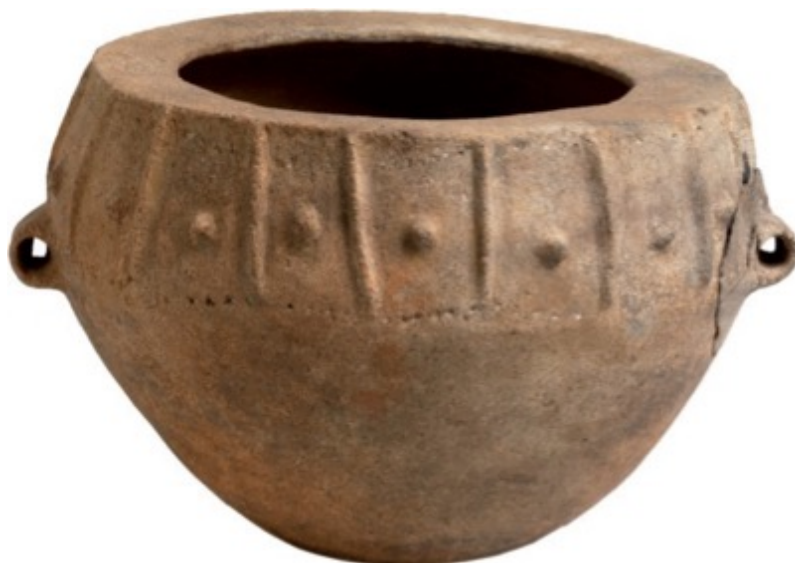
Fig. 4 - Olla bicónica con borde hacia el interior, de la tumba de los gigantes 1 de San Cosimo - Gonnosfanadiga, siglos XV-XIV a.C. (de BAGELLA 2014, pág. 236, ficha 31).

Desde el punto de vista tipológico, las ollas de la era nurágica se dividen en tres clases: borde no distinguido de la pared; borde distinguido de la pared y borde tipo cuello. Cuenta con una pasta depurada y una superficie lisa y ligeramente brillante, con una decoración plástica formada por cordones y nervaduras en la parte trasera en sentido vertical o diagonal, a menudo con secciones cónicas o en relieve. Se caracterizan por unas asas anchas o angulares y redondas, que en algunos casos tenían un pequeño mango. En la Edad del Bronce Media fueron características y típicas las ollas casi sin decoración con un borde hundido que incluye ciertos elementos. En cambio, en la fase avanzada, apareció la olla ovoide con borde hacia el interior, bicónica y con dos asas, que se ha encontrado, por ejemplo, en la tumba de los gigantes de San Cosimo-Gonnosfanadiga (fig. 4), con una decoración plástica con nervaduras verticales paralelas y simétricas, intercaladas con pequeños elementos circulares, delimitadas en la parte inferior y superior por dos franjas horizontales de puntos gruesos grabados.