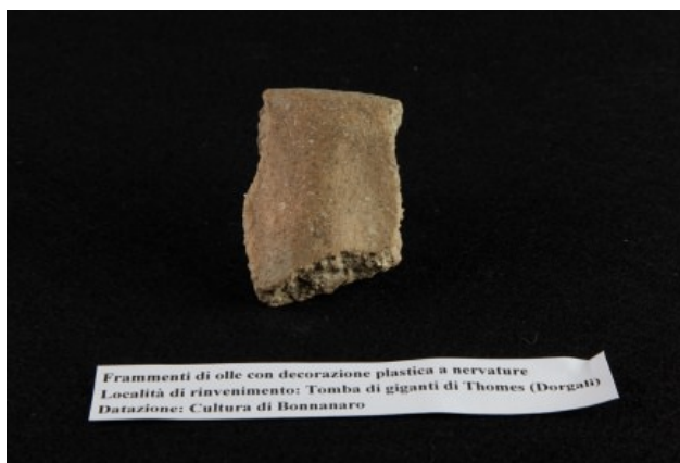
Figs. 1, 2, 3 - Fragmentos de paredes de ollas de Thames-Dorgali decoradas con motivos con nervaduras en relieve bajo el borde.

La olla es un objeto de mesa de forma vascular, modelado a mano en la era prenurágica y nurágica, una especie de contenedor que usaban para conservar o cocinar comida.