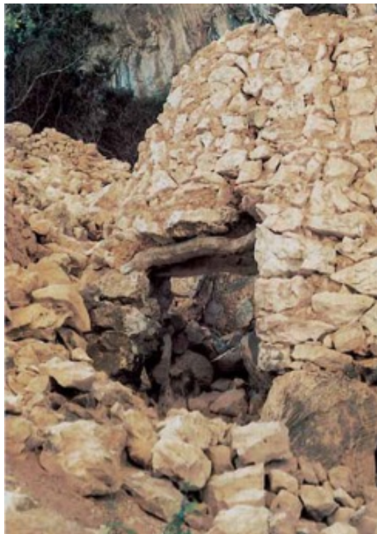
Fig. 4 - Cabaña con una entrada con architrabe de madera de la aldea de Tiscali (de MORAVETTI 2005, fig. 87, pág. 102).