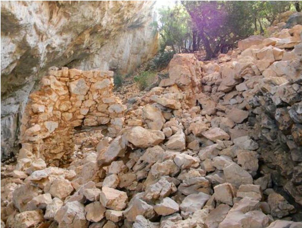
Fig. 3 - Restos de estructuras de la aldea de Tiscali