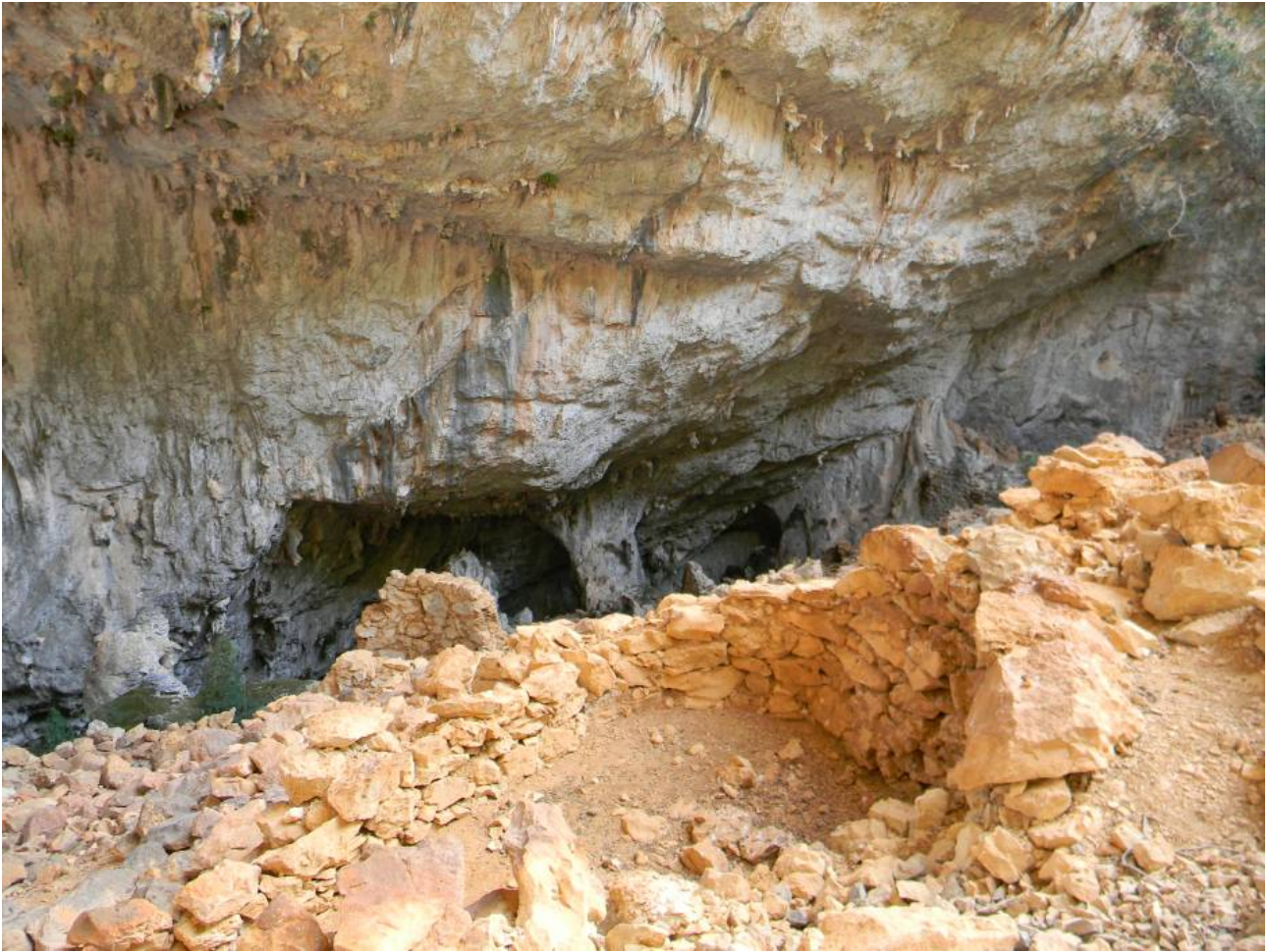
Fig. 2 - Detalle de la aldea de Tiscali

El primer asentamiento está formado por aproximadamente 40 cabañas y se encuentra en el sector norte de la cavidad. El segundo está en el lado suroeste y está compuesto por alrededor de 30 viviendas. Los ambientes, la mayoría derrumbados ya, tienen planta rectangular, cuadrangular, circular o subelíptica. Los muros, con un grosor modesto, los construyeron mediante el uso de bloques de caliza local ligeramente labrados y de mortero obtenido con la mezcla de suelo arcilloso y grava, añadiendo también material inerte orgánico. Fijaron los bloques llenando los huecos con mortero, que posteriormente alisaron. En el grosor interno de los muros se observan bargueños y nichos. Algunas estructuras tienen forma troncocónica con paredes salientes, en un origen probablemente cubiertas con un techo cónico de follaje. Una de estas estructuras luce una entrada con un arquitrabe de madera (fig. 4).