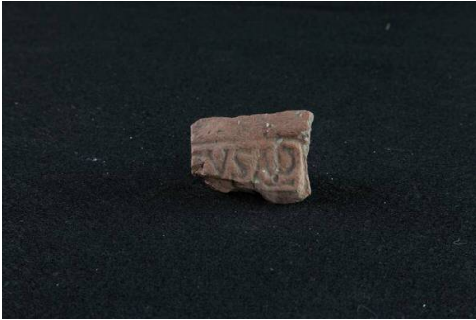
Fig. 2 - Fragmento de ímbrice con sello impreso sobre un cartucho egipcio de forma rectangular [EVSAP]. Hallado en la tumba de los gigantes de Thomes-Dorgali.

Entre los hallazgos más antiguos se encuentra un fragmento de la pared de una jarra sin color (fig. 3), hallado cerca de la exedra, que conserva todavía una parte de una inscripción, datada del siglo IV-III a.C. (Era Republicana).