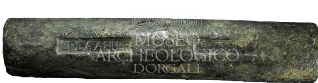
Fig. 3 - Lingote de plomo hallado en las aguas hacia Cala Cartoe-Dorgali, datado del siglo II-I a.C..

Una de las localidades a la que es necesario hacer referencia para definir la historia del paisaje y la geografía del territorio es la de la estación romana Viniolae , en el territorio de Dorgali (Finiodda, valle de Oddoene), que se cita en el Itinerario de Antonino, ubicada a lo largo del iter a Portu Tibulas Karalis . En las cercanías de este trazado vial, que se desarrollaba a lo largo de la costa oriental de Cerdeña, fue donde principalmente se distribuyeron los asentamientos. También se han encontrado otros yacimientos en las dos diverticula , es decir, bifurcaciones transversales dirigidas hacia el interior, en dirección del valle de Isalle y de Oliena, hacia la Barbagia interior.