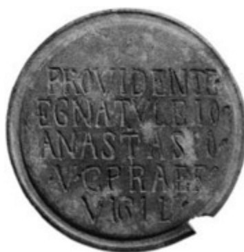
Fig. 2 - Disco de bronce con inscripción tardo-romana de Siddai, Dorgali (de DELUSSU, IBBA 2012, fig. 2, pág. 2197).