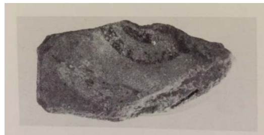
Figs. 3, 4 - Oroviddo-Dorgali, fragmento de copa greco-oriental con fondo pintado (de MANUNZA 1995, fig. 263a-b, pág. 198).