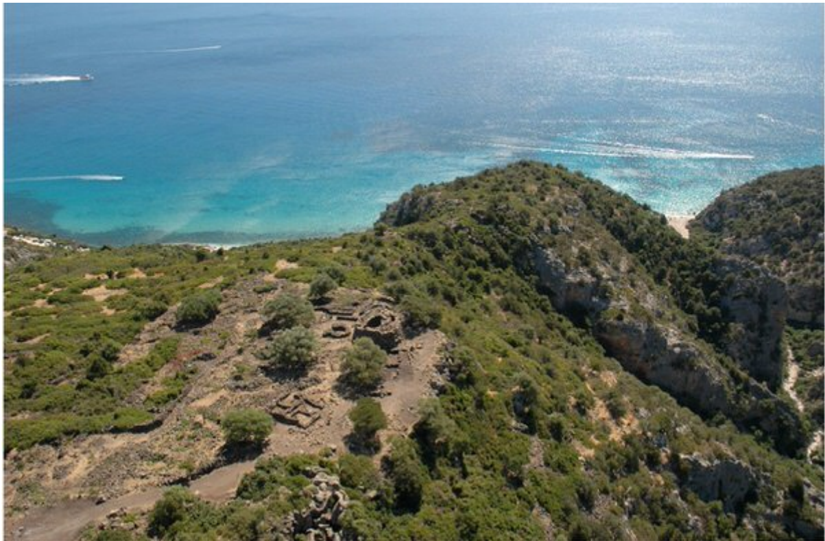
Fig. 2 - Nuraga Mannu, Dorgali (de DELUSSU, 2009, fig. 1, pág. 1).

El nuraga (fig. 3) es de tipo simple de tholos, construido con grandes bloques poligonales de piedra local (altura residual 4,70- 3,50 m, sobre 13-8 hileras; diámetro 12,80 m en la parte inferior, 11,20 m en su parte más estrecha). A través de un pasillo trapezoidal con un arco adintelado con una ventana de descarga, con una escalera de la que sólo quedan 12 escalones, se accede a la cámara de planta subelíptica, con dos nichos elevados y formados dentro del grosor del muro. Las excavaciones que se hicieron del nuraga han desvelado numerosos materiales de cerámica de la era nurágica que van desde la Edad del Bronce Media hasta la Edad del Hierro (siglo XV-IX a.C.). Alrededor del área del nuraga se encontraban las cabañas circulares de la aldea nurágica, realizadas con piedras poligonales de un tamaño mediano.