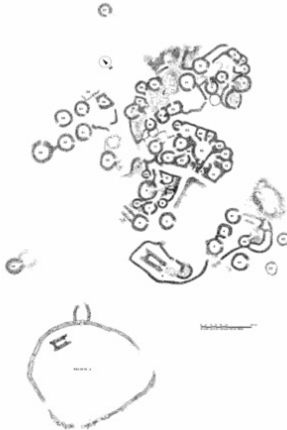
Fig. 2 - Planimetría del yacimiento de Serra Orrios, Dorgali (de MORAVETTI 1998, fig. 25, pág. 34).

Las cabañas de la aldea están divididas en seis áreas de varios ambientes, abiertas alrededor de un patio común, donde cuentan con sistemas de recogida de agua. Las estructuras residuales están caracterizadas por un perfil bastante irregular y fueron construidas con un zócalo formado por hileras de piedras en cuya parte inferior hubo una supuesta cubierta de paja. Además, se han hallado nichos en algunas paredes. Los suelos estaban formados por losas de piedra, eran empedrados o rústicos. En el centro de las cabañas, cerca de la entrada, solía haber un fogón excavado en el suelo con forma circular delimitado por piedras (fig. 3).