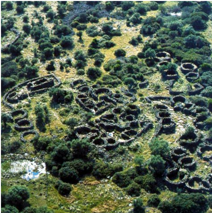
Fig. 1 - Vista aérea del yacimiento de Serra Orrios, Dorgali.