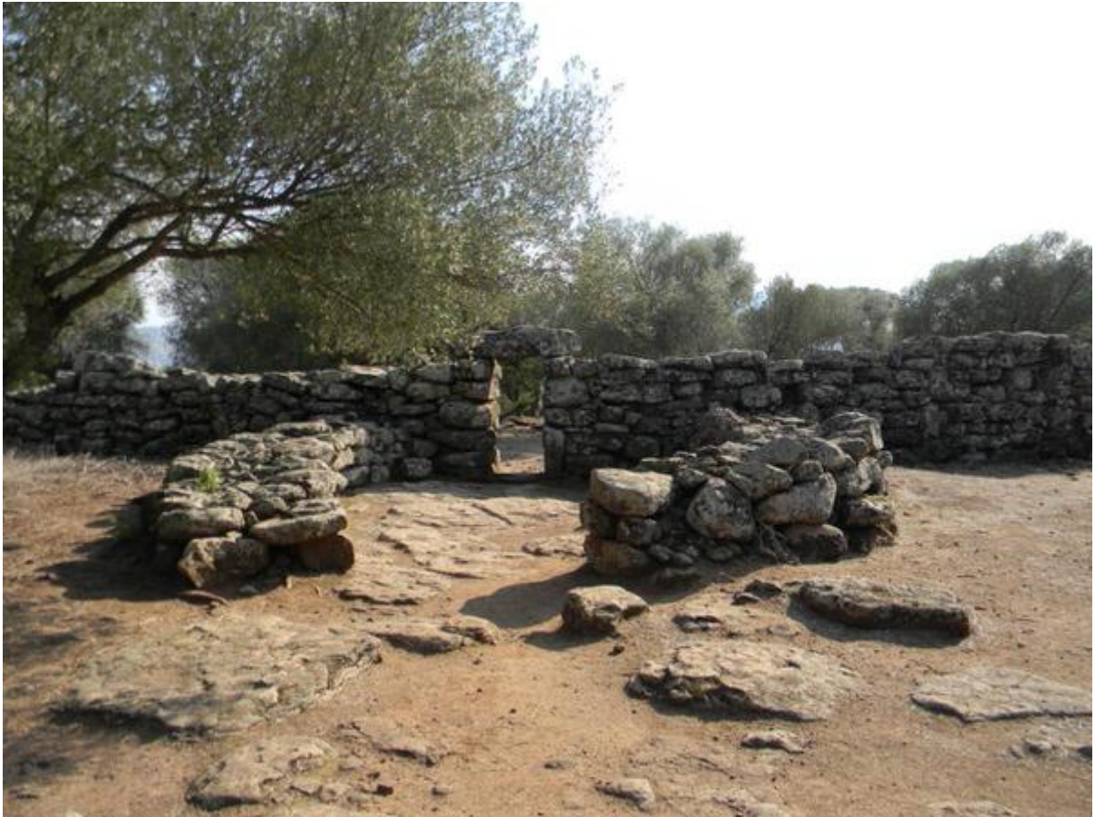
Fig. 4 - Entrance to fence A inside which a Megaron temple was found.

El material hallado en Serra Orrios, de carácter nurágico y bastante escasos si se tiene en consideración su extensión, demuestran las actividades vinculadas con el ámbito doméstico, la industria metalúrgica, la elaboración de pieles, la agricultura y el molido de cereales, y, además, datan de un arco cronológico entre la Edad del Bronce Media y la Edad del Hierro (siglos XVII-VIII/VI a.C.).