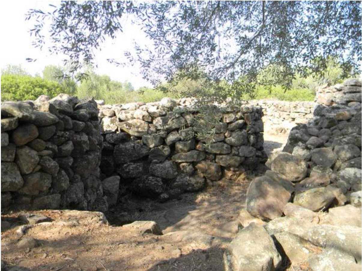
Fig. 3 - Las cabañas de la aldea de Serra Orrios-Dorgali.

En un área aislada había una supuesta cabaña de las reuniones, donde se reunían con motivo de ceremonias colectivas. Estaba caracterizada por una forma con efecto elíptico y se accedía a la misma a través del pasillo realizado con losas ortostáticas. Además, contaba con un banco a lo largo de todo el muro.