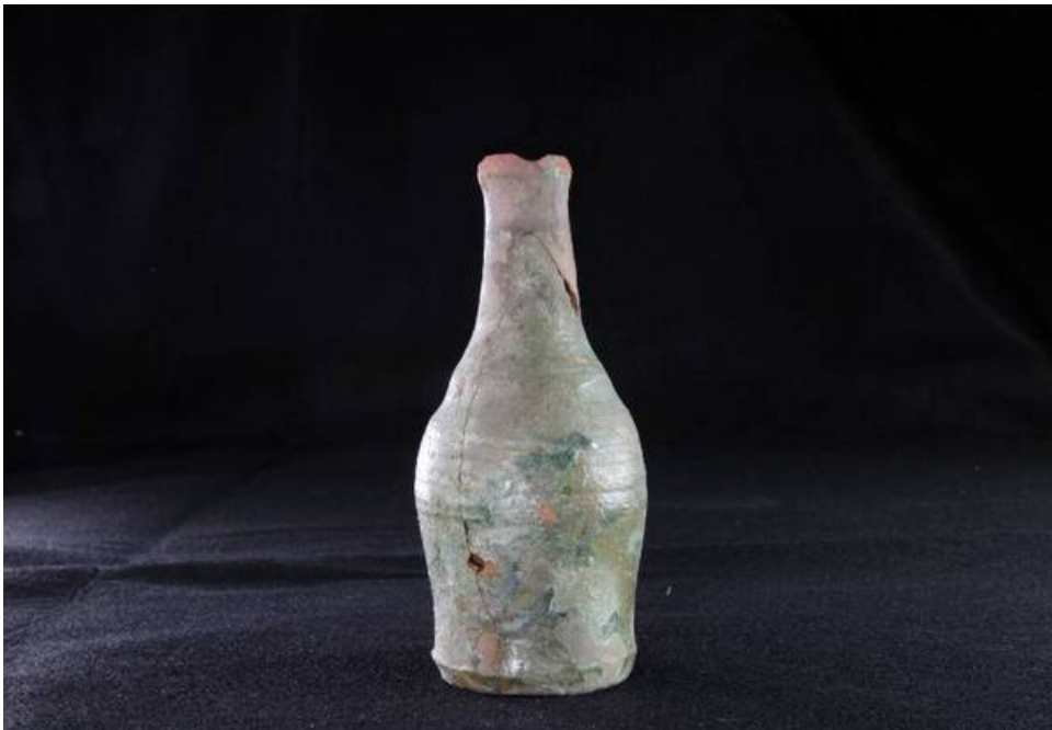
Fig. 3 - Botella de cerámica vidriada de la tumba de los gigantes de Thomes-Dorgali.

El uso de la tumba en la Edad Media Alta podría estar justificada por la cercanía de las dos aldeas medievales de Nurule e Isarle (fig. 3).