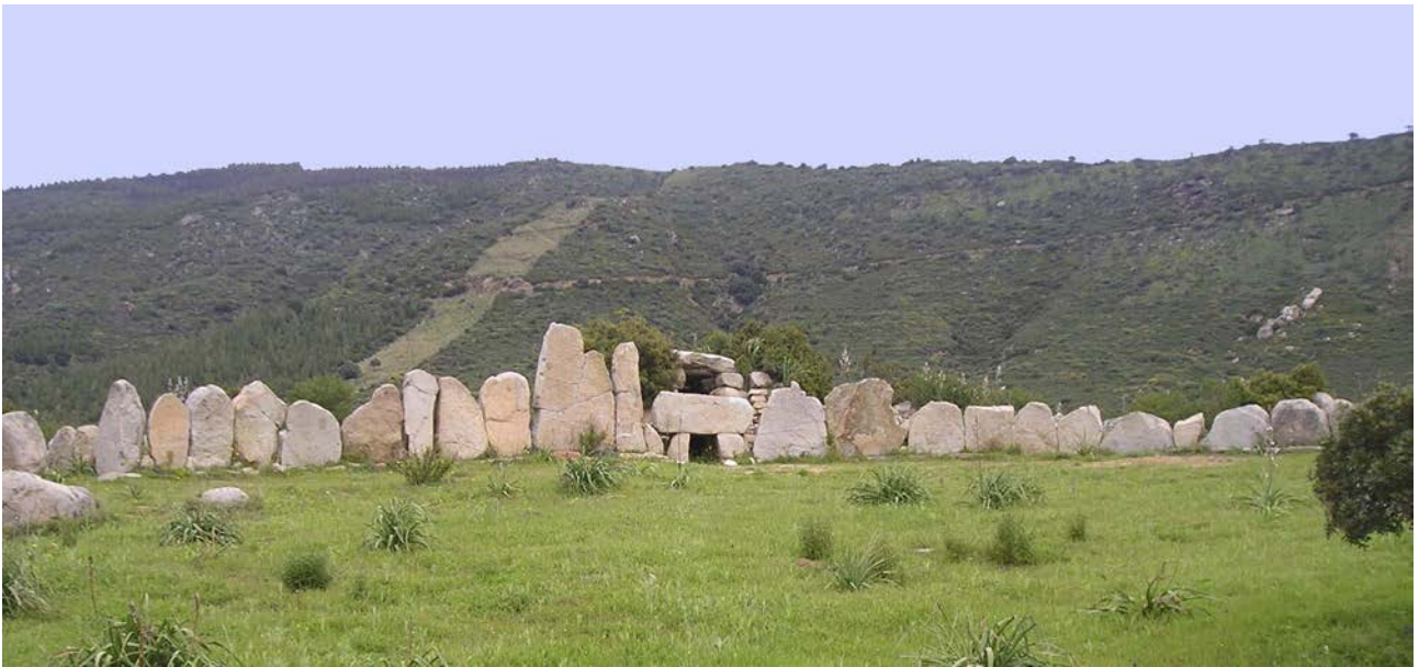
Fig. 4 - Tumba de los gigantes de Osono, en el territorio de Triei.

El fenómeno de reutilización de la cámara sepulcral se puede comparar, por ejemplo, con la tumba de los gigantes de Osono, en el territorio de Triei (fig. 4), donde se han hallado restos de la era romana imperial (siglo III d.C.), y con la cámara de la tumba de los gigantes 2 de Iloi, en el territorio de Sedilo (figs. 5, 6), sepultura con parte delantera con hileras y técnica isódoma, cuyo uso se prolongó hasta la Edad Media Alta (siglo VIII d.C.).