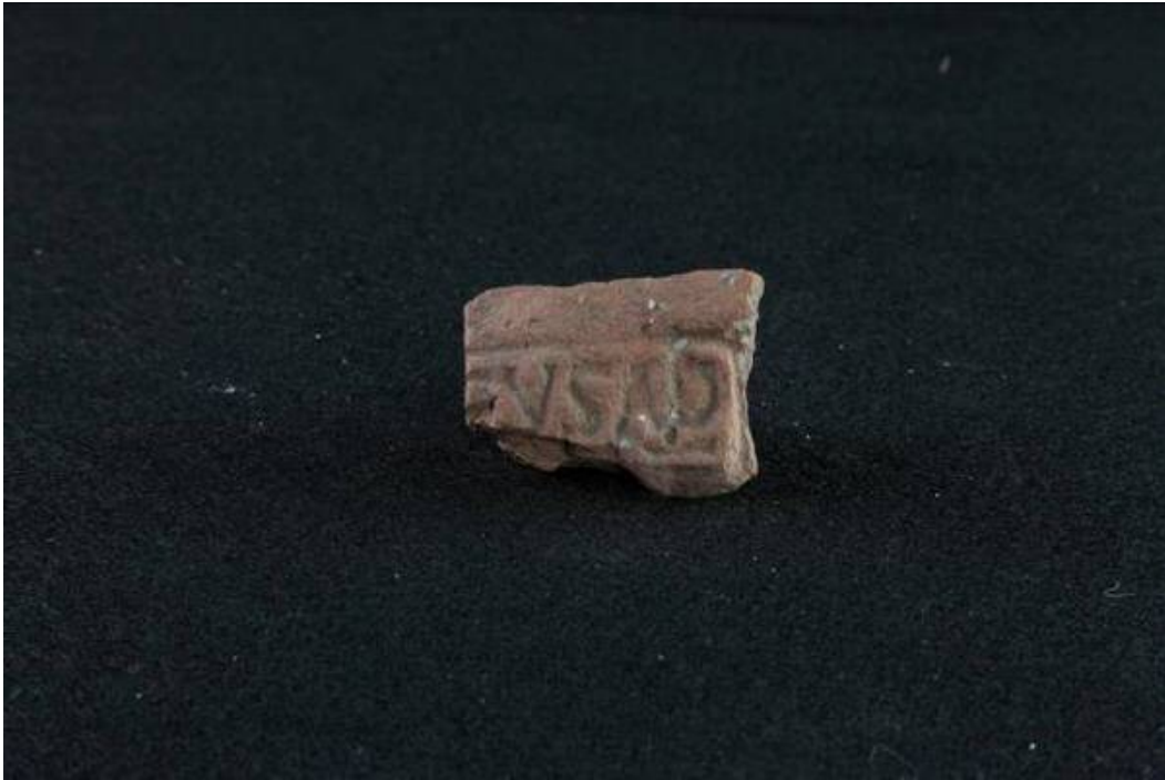
Fig. 2 - Fragmento de ímbrice con sello impreso sobre un cartucho egipcio de forma rectangular [EVSAP]. Hallado en la tumba de los gigantes de Thomes-Dorgali.

El uso de la tumba en la Edad Media Alta podría estar justificada por la cercanía de las dos aldeas medievales de Nurule e Isarle (fig. 3).