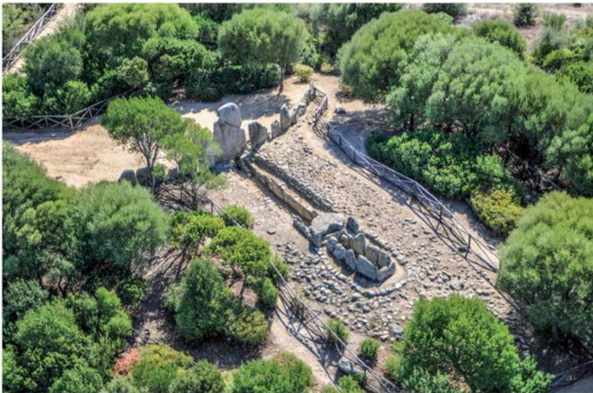
Fig. 2 - Tumba de los gigantes de Li Lolghi-Arzachena (de MORAVETTI 2014, pág.53).

Este tipo de monumento, de derivación dolménica, es la evolución de las tumbas con un pasillo cubierto, a las que llamaban alleè couverte . Estaban constituidas por un largo cuerpo, generalmente absidal, y una parte delantera curva que se prolongaba lateralmente en dos alas que delimitan un área ceremonial llamada exedra. El centro de la exedra está caracterizado por la altura máxima del monumento, que disminuye progresivamente hacia los extremos de las alas y hacia el ábside. En el centro-norte de Cerdeña, durante la Edad del Bronce Media II (1400-1300 a.C.), la tumba de ortostatos con la estela arqueada (fig. 2) fue sustituida por un tipo de tumba de mampostería realizada con una técnica isódoma o en bloques poligonales, sin estela, y con una entrada con arquivolta (figs. 3 y 4).