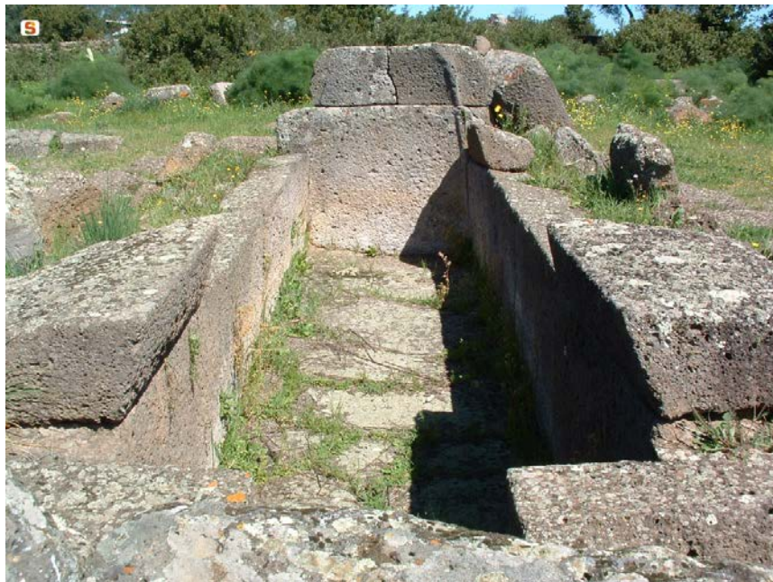
Fig. 3 - Tumba de los gigantes Iloi 2-Sedilo.

La tumba 2 de Iloi, en el territorio de Sedilo (fig. 3) y la tumba de San Cosimo, en el territorio de Gonnosfanadiga (fig. 4) forman parte del tipo de tumbas de hileras.