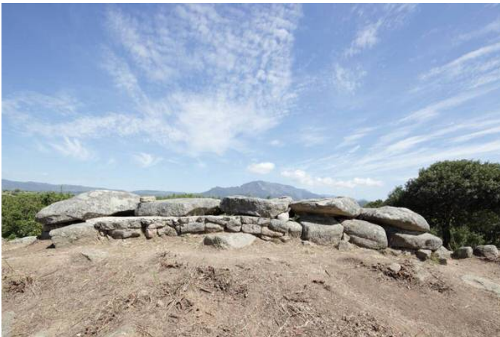
Fig. 3 - Vista lateral del monumento que muestra los detalles de la cubierta