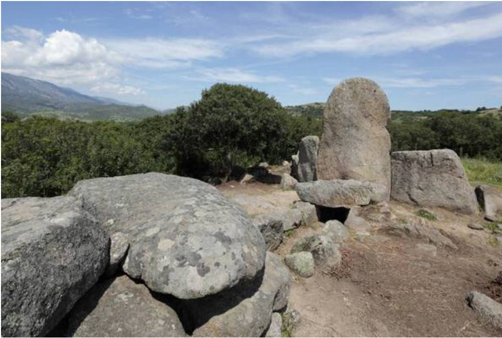
Fig. 2 - Pasillo funerario visto desde la parte trasera