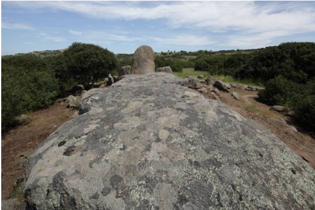
Fig. 4 - Detalle de las grandes losas de granito que formaban la cubierta.