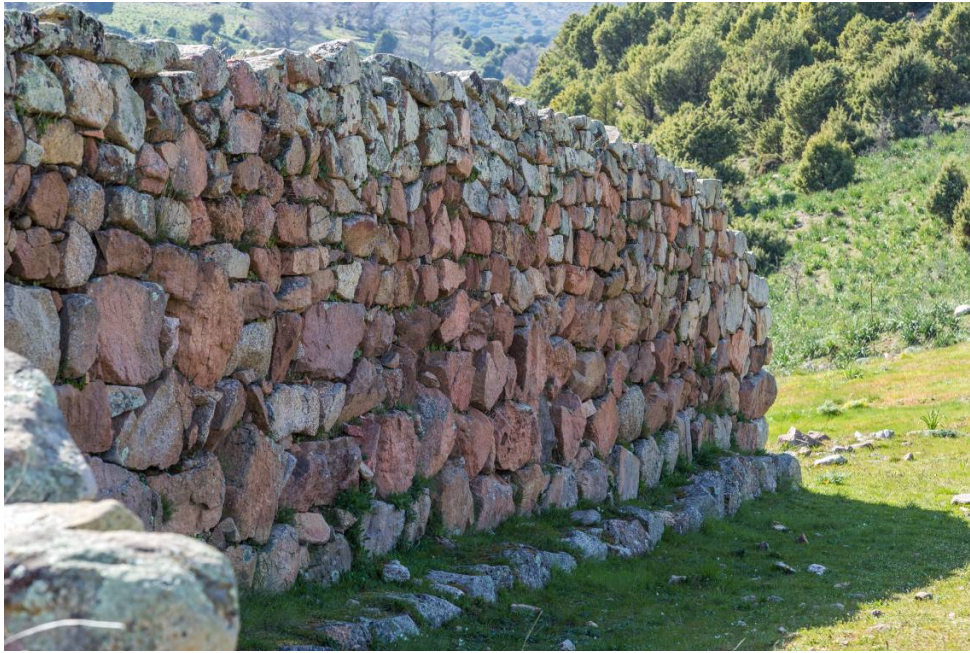
Fig. 2 - Detalle del área externa del templo de megaron 1 (foto de Unicity S.p.A.).

Este se relacionó con la destrucción del marco de madera formado por vigas de madera y follaje, que sería el techo a dos aguas original, que se completó por la inclinación compuesta por losas líticas (fig. 3).