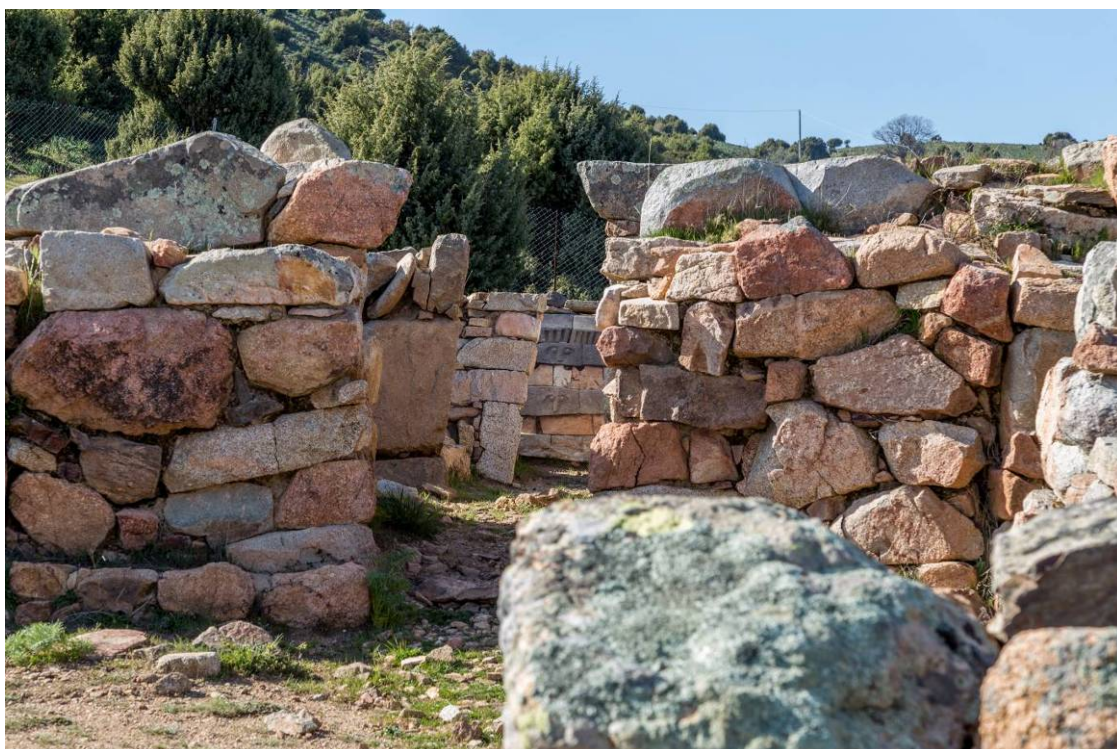
Fig. 3 - Vista general del interior del templo. Al fondo, detalle de la reconstrucción del altar-fogón