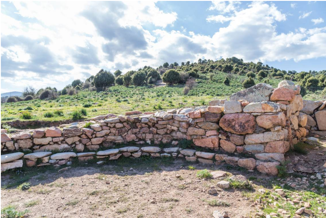
Fig. 2 - La banca del temenos.

culto, que incluía un banco en todo el perímetro interno formado por grandes piedras de río (fig. 2), con la entrada orientada hacia el sur y en eje con las tres entradas con arquivolta del templo.