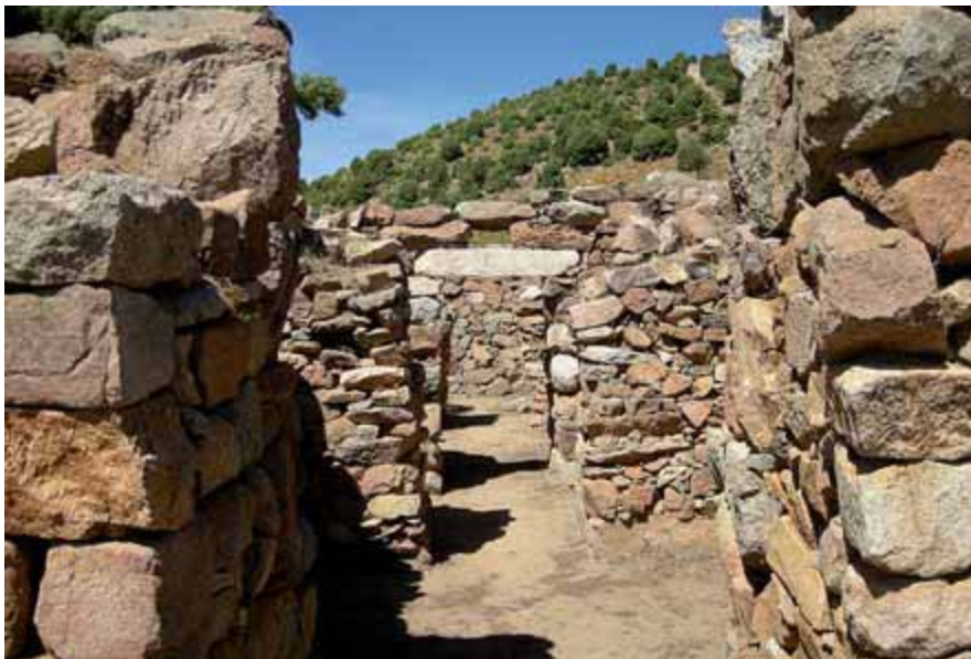
Fig. 1 - Ambientes del megaron 1 (de FADDA 2012, pág. 11, fig. 10).

Por ejemplo, en el área sagrada usaron el granito, como en la mayoría de los nuragas de la zona, para crear muros compuestos por hileras irregulares de diferentes tamaños (fig. 1).