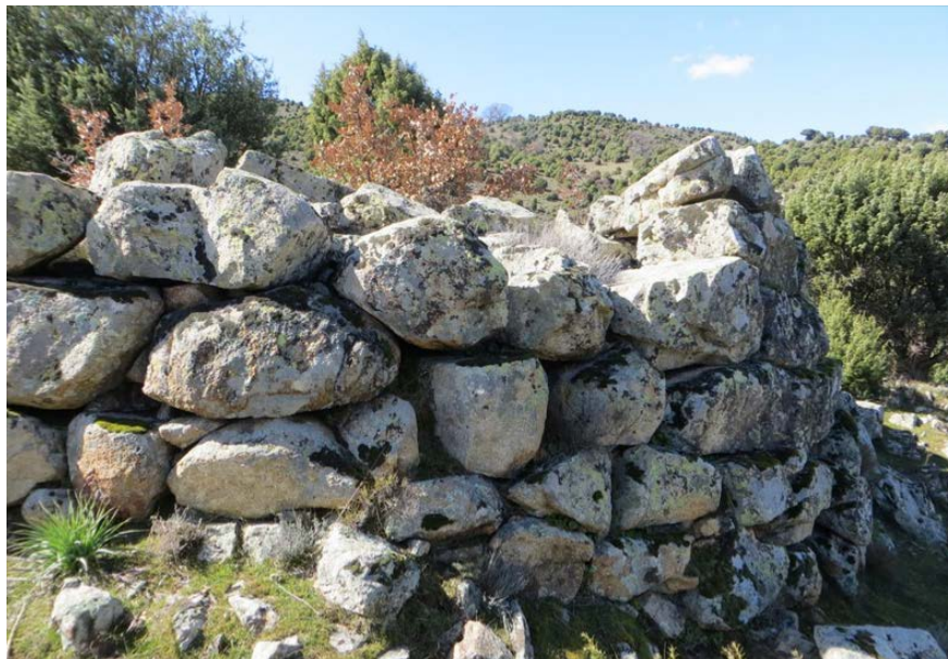
Fig. 2 - Nuraga Lalzoracesus o Lotzoracesa

Respecto al aspecto arqueológico, hoy en día el marco documental es bastante selectivo y fragmentado. Los restos de los nuragas (fig. 2) y de la tumba de los gigantes (fig. 3), indicios arqueológicos muy valiosos, podrían indicar que aquí edificaron un lugar estable para las personas que pasaban por la trashumancia.