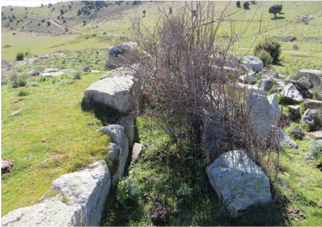
Fig. 3 - Tumba de los gigantes en el área del nuraga Lalzoracesus o Lotzoracesa.