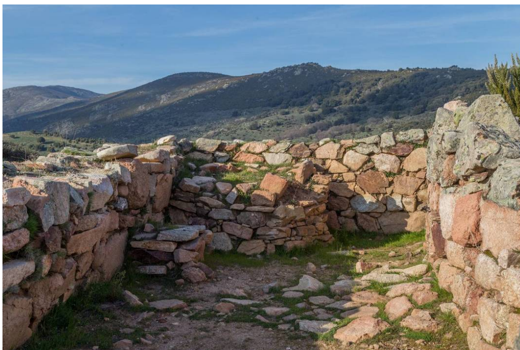
Fig. 3 - Megaron 3.

Sobre el antiguo fogón, que todavía se conserva, realizaban nuevas técnicas de elaboración de metales. De esta forma, renovaban cada vez la superficie de arcilla de la base. En el lado noroeste, en un espacio alabierto y ligeramente cóncavo, estaban las toberas del fuelle que alimentaban el fuego (fig. 4).