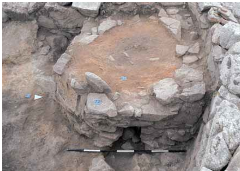
Fig. 4 - Horno-chimenea (de FADDA 2012, fig. 51, pág. 36).

Sobre el antiguo fogón, que todavía se conserva, realizaban nuevas técnicas de elaboración de metales. De esta forma, renovaban cada vez la superficie de arcilla de la base. En el lado noroeste, en un espacio alabierto y ligeramente cóncavo, estaban las toberas del fuelle que alimentaban el fuego (fig. 4).