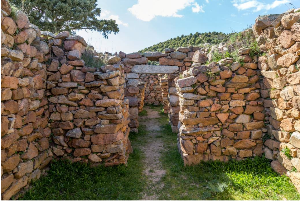
Fig. 2 - Interior del templo de megaron 1. Al fondo, el ambiente D.

Aún hoy en día se puede observar parte del suelo original de losas. En el muro del fondo hay un pequeño niño elevado con forma subtrapezoidal, que está perfectamente en línea con todos los pasillos de los ambientes del templo (fig. 3).