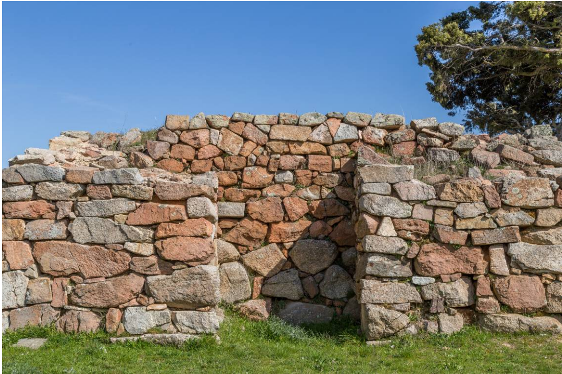
Fig. 3 - Detalle de la parte trasera del templo de megaron 1.

El agua que usaban para los rituales que realizaban en el templo pasaba al exterior a través de una abertura rectangular del lado derecho del segundo ambiente, y confluía dentro de una canaleta delimitada por ortostatos cubiertos por pequeñas losas planas.