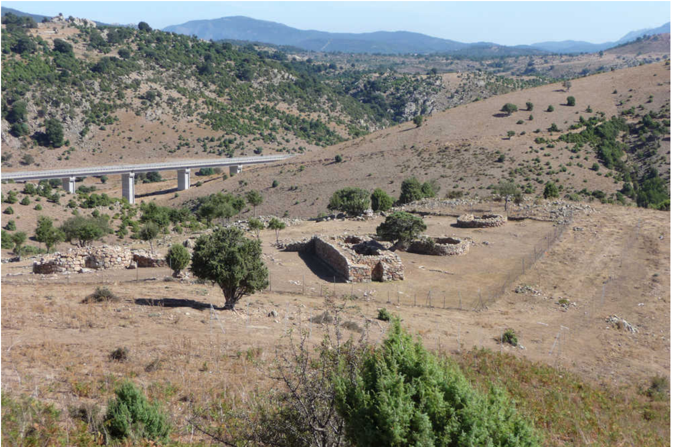
Fig. 3 - Panorámica del yacimiento (de http://www.beniculturali.it/mibac/export/MiBAC/sito-MiBAC/Menu Utility/Immagine/index.html_647931255.html ).

Las excavaciones que realizaron en el primer templo de megaron durante las décadas de 1980 y 1990, algunas de las cuales finalizadas para analizar los saqueos desconocidos de los excavadores clandestinos, han hecho hincapié sobre la importancia del lugar y, además de identificar la clase, la extensión y la consistencia del templo, además de las diferentes fases de uso y las supuestas relaciones con el área residencial, también han comprobado que, en relación con los materiales hallados, también fue edificado sobre un antiguo asentamiento. En los años 2007-2011 realizaron más excavaciones que desvelaron otros dos edificios templarios inéditos: el megaron 2, y, en el interior del ambiente del fondo del área absidal, un altar formado por bloques escuadrados de rocas volcánicas decorado con prótomos de ariete en relieve, y un fogón para los rituales compuesto por bloques de basalto que imitaban la parte superior de una torre nurágica.