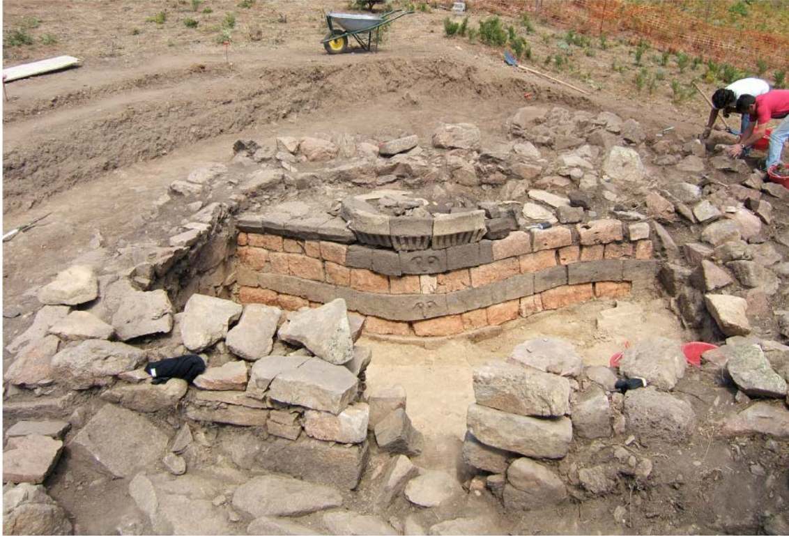
Fig. 8 - El espacio absidal donde se halló el altar-fogón durante las excavaciones (de Congiu 2013, fig. 5 pág. 1475).

Este templo también se encuentra dentro de un gran temenos de forma irregular y con una banca, a la que se asoman otros dos ambientes rectangulares: en este espacio probablemente realizaban los rituales del culto, como indican los numerosos restos que demuestran una frecuentación entre la Edad del Bronce final y la Primera Edad del Hierro. Las excavaciones que se han realizado en el edificio han identificado 3 fases de construcción distintas. A principios de la Edad del Bronce reciente, construyeron un templo rectangular con la parte delantera in antis y el muro del fondo absidal. Durante la Edad del Bronce final, cerraron la primitiva entrada in antis con un muro y añadieron el temenos , cuya entrada, hacia el sur, era lineal con las entradas de los ambientes con arquitrabe del templo. En el pequeño espacio del ambiente absidal crearon un altar-fogón. Durante la Edad del Hierro, en la tercera fase de construcción, añadieron otros espacios de planta rectangular, a los que se podía acceder mediante una entrada abierta en el lado derecho del temenos .