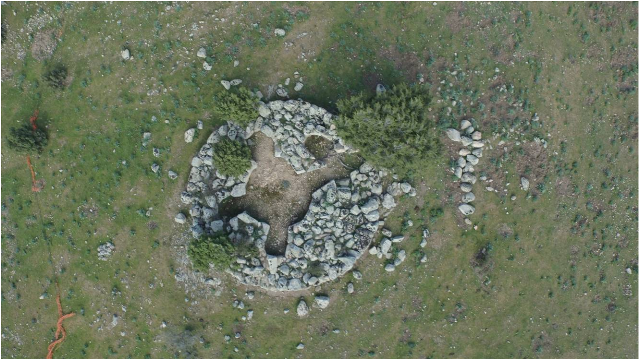
Fig. 2 - Foto aérea del nuraga S'Arcu'e Sforru.

Durante algún tiempo, el lugar sufrió numerosas destrucciones de mano de excavadores clandestinos. Como consecuencia, incluso con el fin de detener el saqueo de esta amplia área arqueológica, a partir de la década de 1980, la Superintendencia arqueológica de Cerdeña, bajo la Dirección científica de Maria Ausilia Fadda, realizó unas excavaciones gracias a cuyos resultados han contribuido a conocer aspectos topográficos y planimétricos, y al hallazgo de objetos de un gran valor científico, que detallan algunos aspectos de la vida cotidiana, de las actividades de producción y de la religiosidad de la comunidad nurágica de la zona.