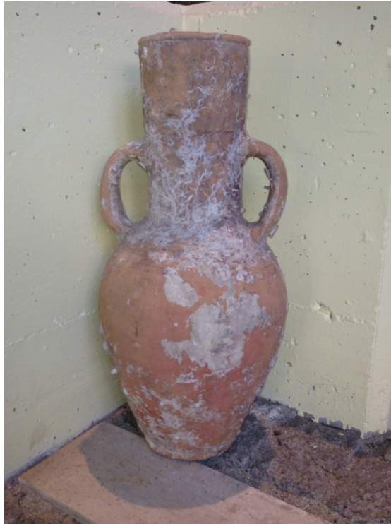
Fig. 2 - Anforeta, Museo arqueológico de Villasimius.

De un pecio islámico del siglo X d.C. hallado en las aguas de Cannes, a 58 m de profundidad, proviene una gran cantidad de objetos de cerámica, como "jarritas" (fig. 3) que, por su cuello alto, recuerdan a la anforeta que se ha analizado.