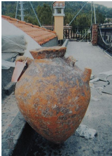
Fig. 1 – Ánfora con cuerpo ovoide hallada en el mar de Arbatax (de SALVI ET ALII 2005, pág. 72).

Desde finales del siglo VII a.C., en el sur de Etruria comenzó una producción de ánforas para exportar el vino de la región, que duró hasta el siglo III. Estos contenedores se han hallado en numerosas localidades costeras de la península italiana y en varios pecios a lo largo de las costas.