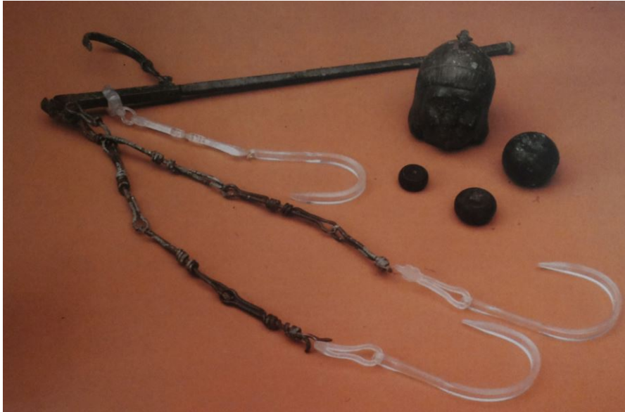
Fig. 4 - Romana de la era romana (del Museo arqueológico "G.A. Sanna" de Sassari 2000, pág. 151).

Si se desliza la romana a través de la escala se llega a una posición de equilibrio donde el brazo se pone en posición vertical. La posición de la romana sobre la balanza indica el peso. La romana tenía forma de un busto humano o de otra figura (fig. 4).