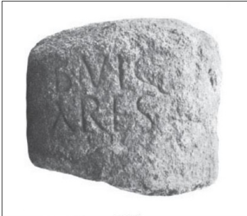
Fig. 2 - El cipo de Tortolì (de MELONI 2000, pág. 1697).

Un epígrafe grabado en la superficie (figs. 3 y 4), datado de la época romana imperial tardía, demuestra la presencia de vulgares (siervos), es decir, campesinos sirvientes que se ocupaban de cuidar la praedia , es decir, las granjas de la era romana 71 . Por lo tanto, muy probablemente, los vulgares del cipo de Tortolì eran esclavos que formaban la mano de obra genérica de un latifundio de la zona.