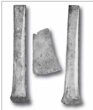
Fig. 3 - Hachas con la cuchilla de bronce elevada y fragmento de una guadaña de S'Arcu 'e is Forros (de FADDA 2012 b, pág. 19, fig. 24).

Además, probablemente hubo intensas relaciones comerciales entre las poblaciones de las montañas de las zonas del interior y las comunidades del territorio costero, como demostrarían las hachas similares halladas en el centro metalúrgico de S'Arcu 'e is Forros de Villagrande Strisaili (fig. 3) y, más hacia el norte, del nuraga de Sisine di Nule (fig. 4).