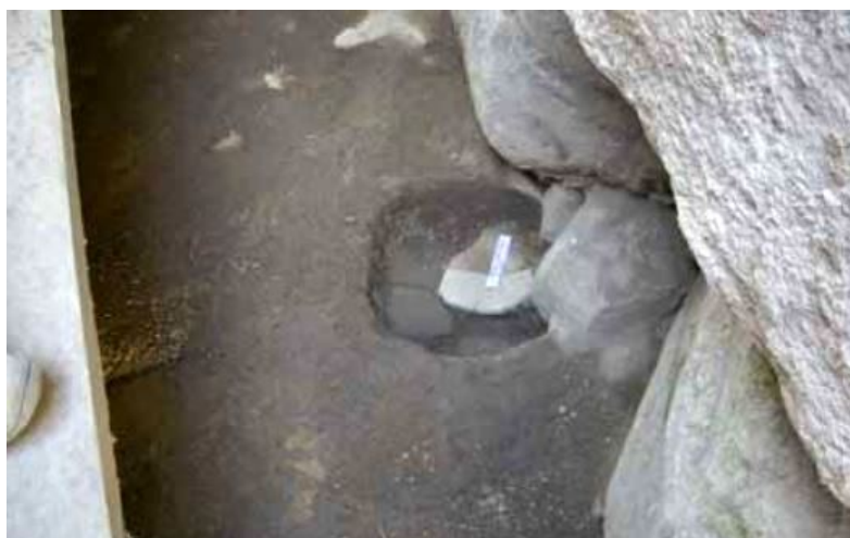
Fig. 1 - El nuraga de S'Ortali 'e su Monte. El pasillo de acceso a la torre con la base del vaso nurágico que contenía las hachas de bronce (foto de FADDA 2012, pág. 40, fig. 55).

En Tortolì, en la localidad de San Salvatore, en el interior del nuraga de S'Ortali è su Monte, en el espacio entre la jamba izquierda de la entrada a la torre principal y el pasillo, se ha hallado el fondo de un vaso con un espesor grueso que se apoyaba sobre una piedra plana (fig. 1). El contenedor contenía un grupo de 19 hachas de bronce con la cuchilla levantada y un talón plano, colocadas de forma ordenada y encajadas de forma alterna (fig. 2). Por su forma, peso y tamaño se pueden clasificar como un tipo de hacha muy común tanto en Ogliastra como en el resto de la isla. La mayoría de estas hachas no tienen la lama estropeada, por lo tanto, su buena conservación podría deberse al resultado de un proceso de atesoramiento relacionado con las actividades comerciales vinculadas con la amplia producción de cereales cultivados en la fértil llanura por la que pasa un río, como lo demuestra la presencia de los 12 silos de mampostería que albergaban las gramíneas recogidas.