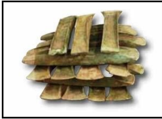
Fig. 2 - El nuraga de S'Ortali 'e su Monte. Reproducción de cómo se encontraron las 19 hachas de bronce: vitrina del museo (foto de FADDA 2012 a, pág. 40, fig. 56).

Además, probablemente hubo intensas relaciones comerciales entre las poblaciones de las montañas de las zonas del interior y las comunidades del territorio costero, como demostrarían las hachas similares halladas en el centro metalúrgico de S'Arcu 'e is Forros de Villagrande Strisaili (fig. 3) y, más hacia el norte, del nuraga de Sisine di Nule (fig. 4).