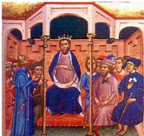
Fig. 3 - Jaime II de Aragón

A este período también corresponde la mención de Tortolì en documentos de 1358 del Departamento de Cerdeña: se trata de la lista de las localidades que debían pagar los impuestos a los nuevos propietarios y a Tortolì, que formaba parte del juzgado de Ogliastra, y que, a su vez, debían entregar los impuestos al noble Berengario Carroz (fig. 4), que los administraba en nombre de los aragoneses.