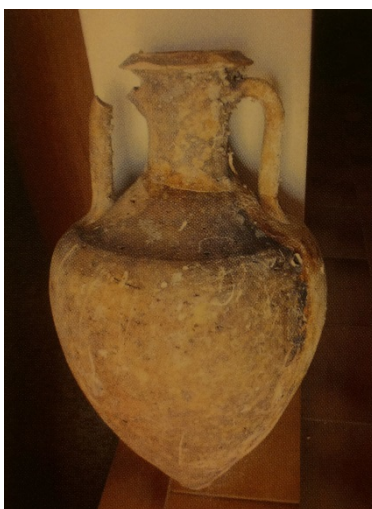
Fig. 3 - Ánfora del mar de Arbatax (de V.V.A.A. 2005, pág. 73).