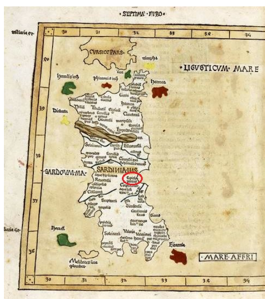
Fig. 4 - Septima Europe Tabula , de Ptolomeus Claudius, Cosmographia , Ulma, 1482. En rojo se indica Sulpicius Portus