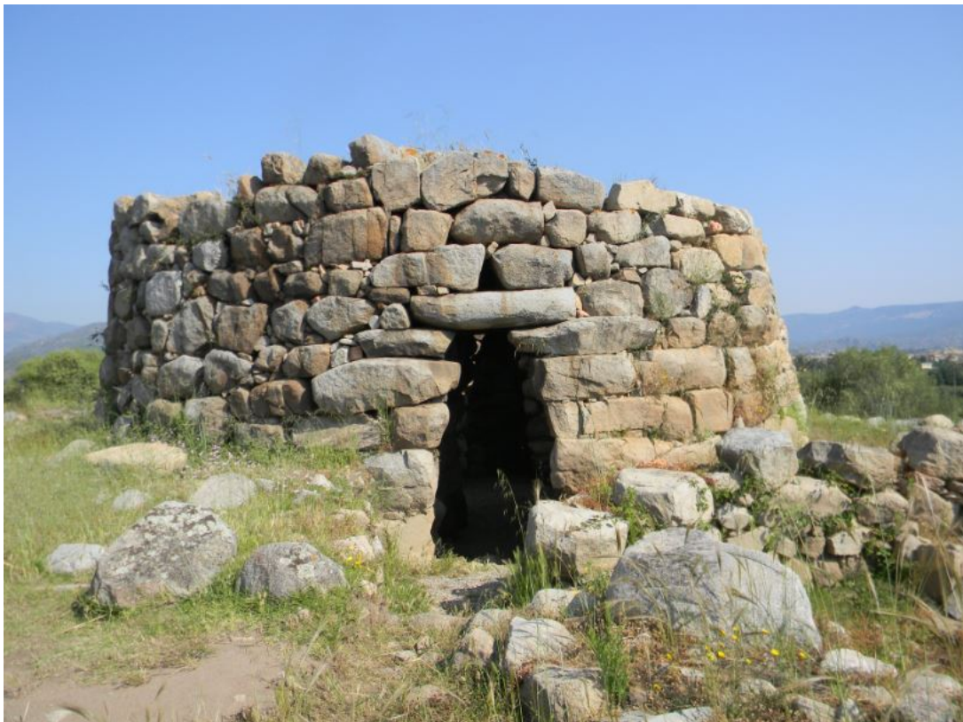
Fig. 2 - El nuraga de S'Ortali 'e su Monte.

En el área arqueológica de S'ortali 'e su Monte, un nuraga (fig. 2) y dos tumbas de los gigantes (fig. 3) demuestran la presencia de un asentamiento cuyos habitantes, que se dedicaban a la agricultura, aprovechaban la tierra fértil para cultivar cereales, como lo indican los 12 silos (fig. 4) de mampostería de finales de la Edad del Bronce y la primera Edad del Hierro (aprox. 1200-900 a.C.). Se trata de un granero, donde almacenaban los cereales de la comunidad y también para el comercio exterior.