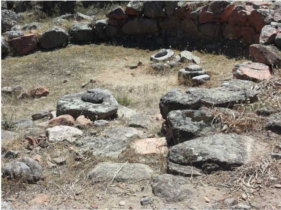
Fig. 5 - Cabaña de la aldea nurágica de S'Ortali 'e su Monte con moletas, muelas de molino y morteros.